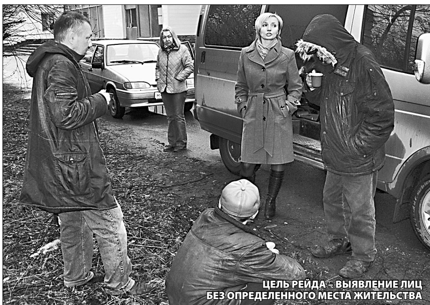
ЦЕЛЬ РЕЙДА – ВЫЯВЛЕНИЕ ЛИЦ БЕЗ ОПРЕДЕЛЕННОГО МЕСТА ЖИТЕЛЬСТВА