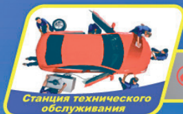
Станция технического обслуживания

Нас знают многие - приезжают лучшие! Будь лучшим!