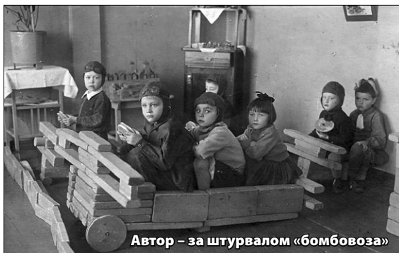
Автор – за штурвалом «бомбовоза»

Популярность Валерия Чкалова – испытателя новых моделей боевых машин сильно возросла во всем мире после