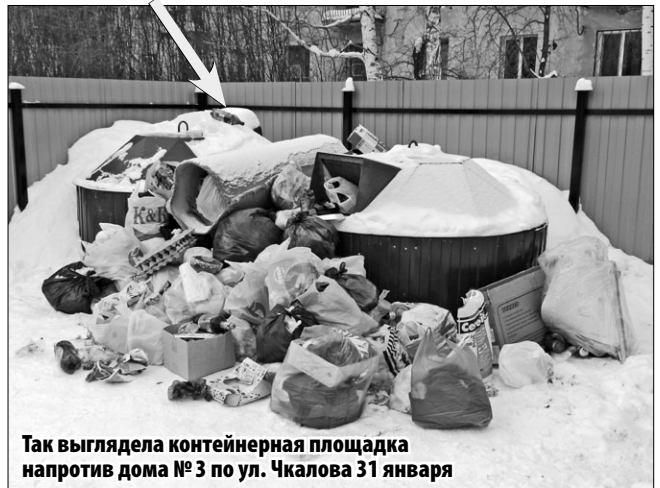
Так выглядела контейнерная площадка напротив дома №3 по ул. Чкалова 31 января

Периодически проходя мимо контейнеров, расположенных рядом с перекрёстком улиц Первомайской и Чкалова (между домами №78 по ул. Первомайской и №3 по ул. Чкалова), часто вижу, что они завалены мусором. Видимо, вывозят его отсюда нерегулярно. А примерно с месяц назад заметил, что крышка одного из контейнеров загрузочным отверстием (на фото показано стрелкой) повёрнута к ограждению. Значит, из двух контейнеров действует только один, и стало понятно, почему рядом с ними так много мусора.