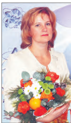
Подготовил Евгений СЕРЕБРЯКОВ

- На конкурсе проекта «Школа Росатома» я представляла программу стажировки учителей «Формирование и оценка предметных результатов обучения в соответствии с требованиями ФГОС». Я уже доходила до финала этого конкурса в 2012 году, но то, что нам предложили в качестве конкурсных заданий, стало настоящим событием. Оказалось, что нам предстоит не только продемонстрировать понимание требований новых стандартов, но и умение адаптироваться к новым условиям. Знания нельзя получить, ими необходимо овладеть - таков был посыл. Ни лекций, ни докладов - только непосредственная деятельность! Я овладела новыми формами организации деятельности, и этот бесценный опыт уже ввожу в практику. Так, у нас проходил праздник, посвященный Дню матери, и там благодаря необычной форме проведения очень удачно сложилось общение между детьми и родителями. Что помогло победить? Не знаю. Я просто показала ту систему работы, которая используется у нас на занятиях в гимназии. Видимо, помогло то, что я сумела гибко реагировать на изменяющиеся обстоятельства задания.