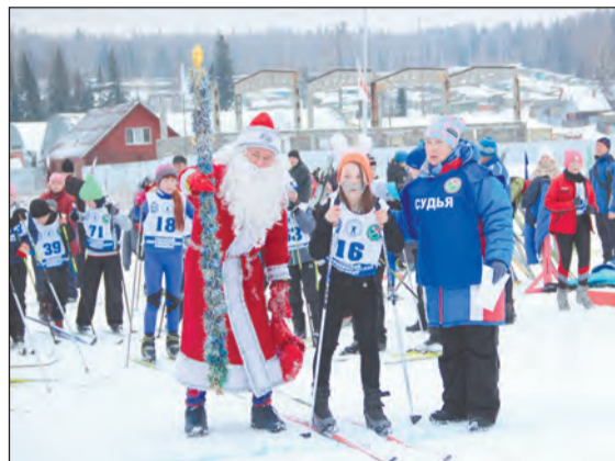
Торжественные проводы на дистанцию

Череда праздничных мероприятий, стартовавшая открытием снежных городков на Центральном стадионе и в детских дворовых клубах, была продолжена соревнованиями по лыжным гонкам, конькам и ориентированию