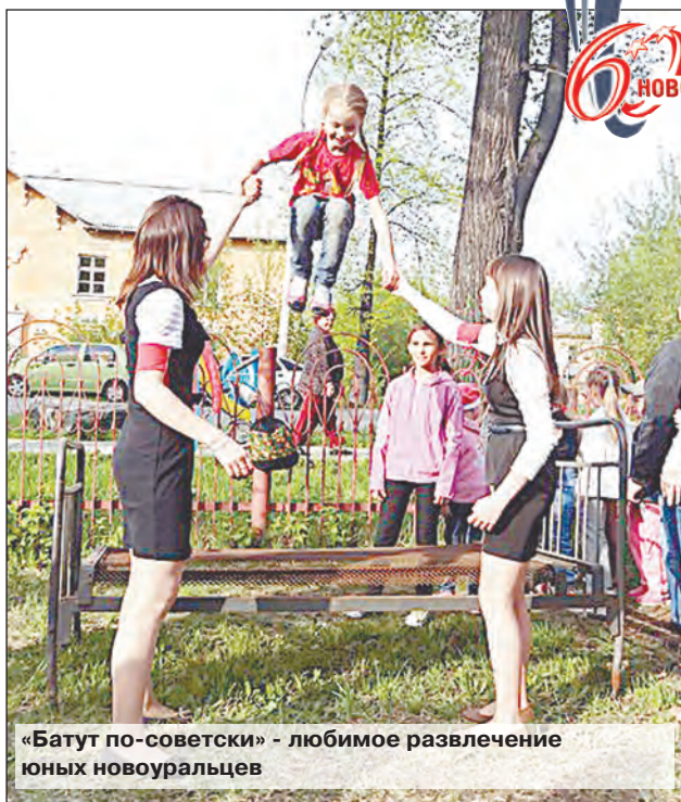
«Батут по-советски» - любимое развлечение юных новоуральцев

Л итературный конкурс «С чего начинается Родина»