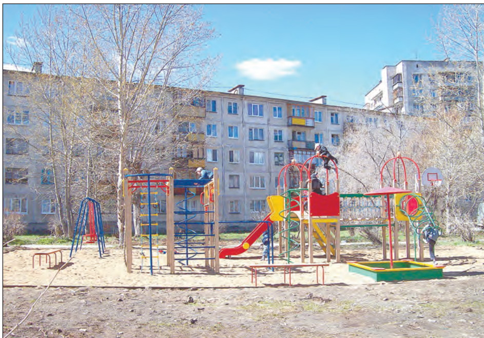
К радости детворы - новая игровая площадка во дворе домов №№ 11 и 13а по улице Комсомольской

И обращение жителей дома № 13 по ул. Комсомольской, просивших вырубить березу, затеняющую естественное освещение в квартирах, не осталось без внимания: вопрос решен положительно.