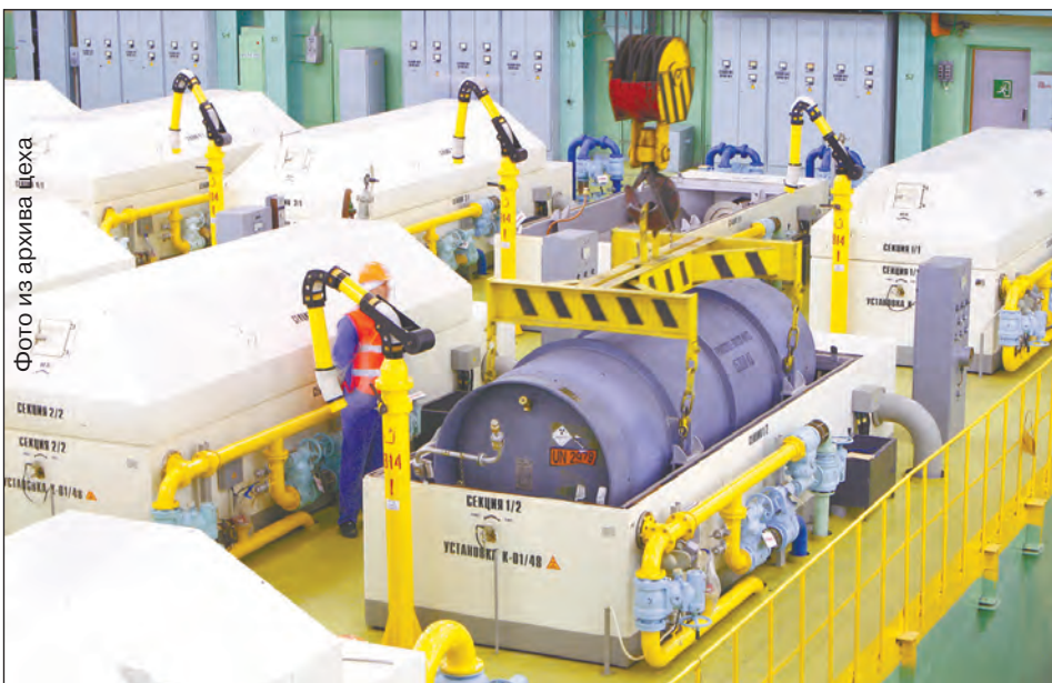
На участке «Челнок» - установка контейнера для включения в работу

Страницу подготовила Жанна АПАКШИНА.