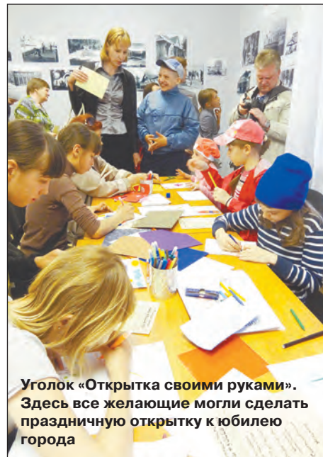
Уголок «Открытка своими руками». Здесь все желающие могли сделать праздничную открытку к юбилею города

Люди, о нас вспомнят! Юности нашей годы Стали уже легендой, Празднует ныне город Стаж шестидесятилетний. Город, построенный нами!