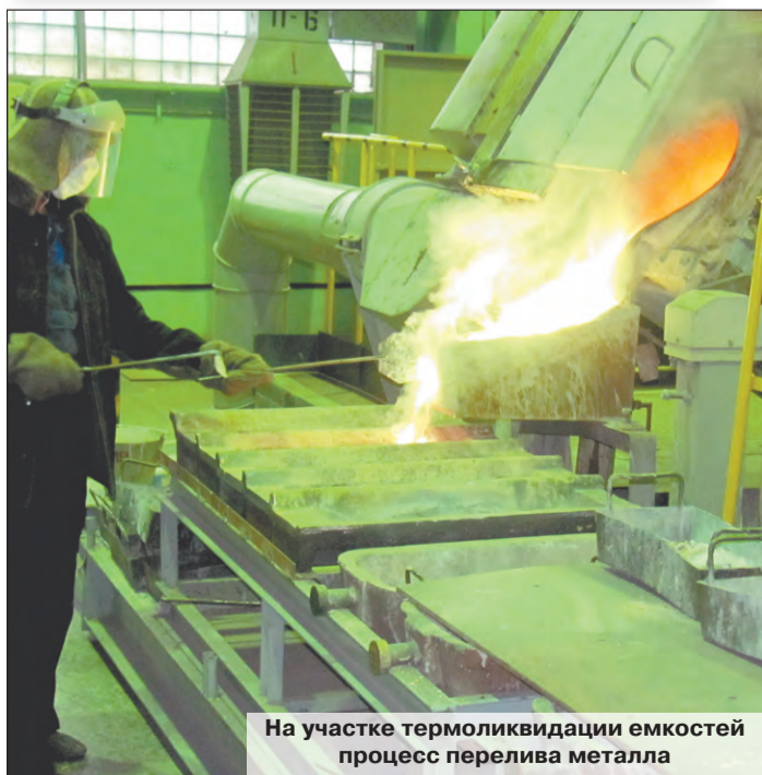
На участке термоликвидации емкостей процесс перелива металла

Страницу подготовила Жанна АПАКШИНА