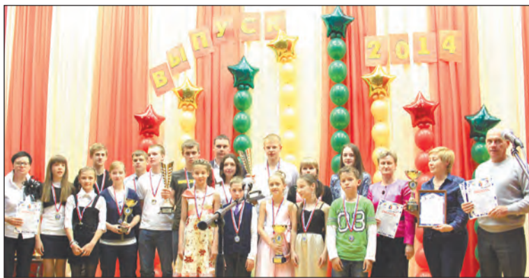
Главные герои спартакиады - юные спортсмены школы № 48