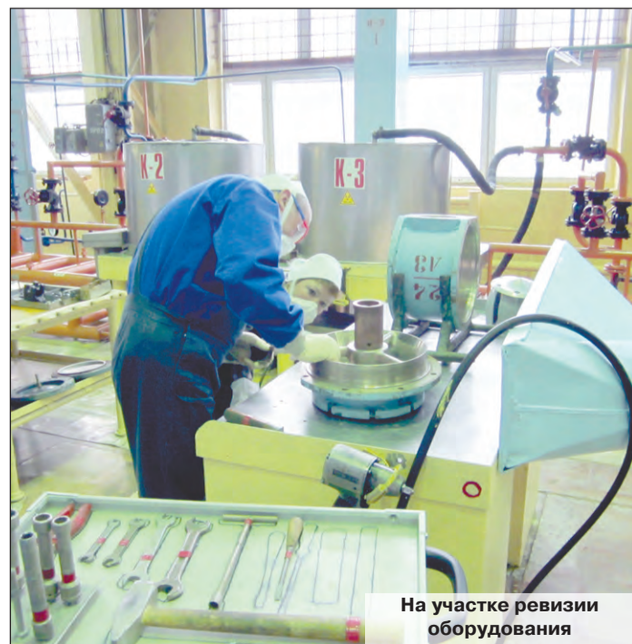
На участке ревизии оборудования