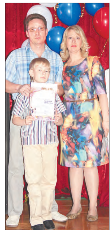
Обладатели гран-при - семья Пономаревых

Евгений СЕРЕБРЯКОВ