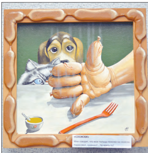
«Сосиски» - одна из представленных работ