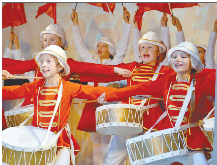
Творческий подарок от коллектива «Колибри» ДК УЭХК