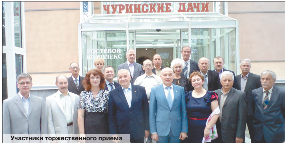
Участники торжественного приема

30 лет работаю на комбинате. Наше подразделение обеспечивает технологической водой для охлаждения основных цехи. У нас - самые мощные турбины в России! Но и коллектив под стать - в бригаде десять человек, и восемь из них имеют самую высокую квалификацию! Когда узнал, что мое имя будет занесено в Книгу почета, конечно, обрадовался, хотя, признаться, совсем не ожидал такого. Желаю родному комбинату процветания!