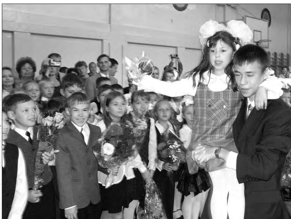
Первое сентября в школе № 40. 2006-й год