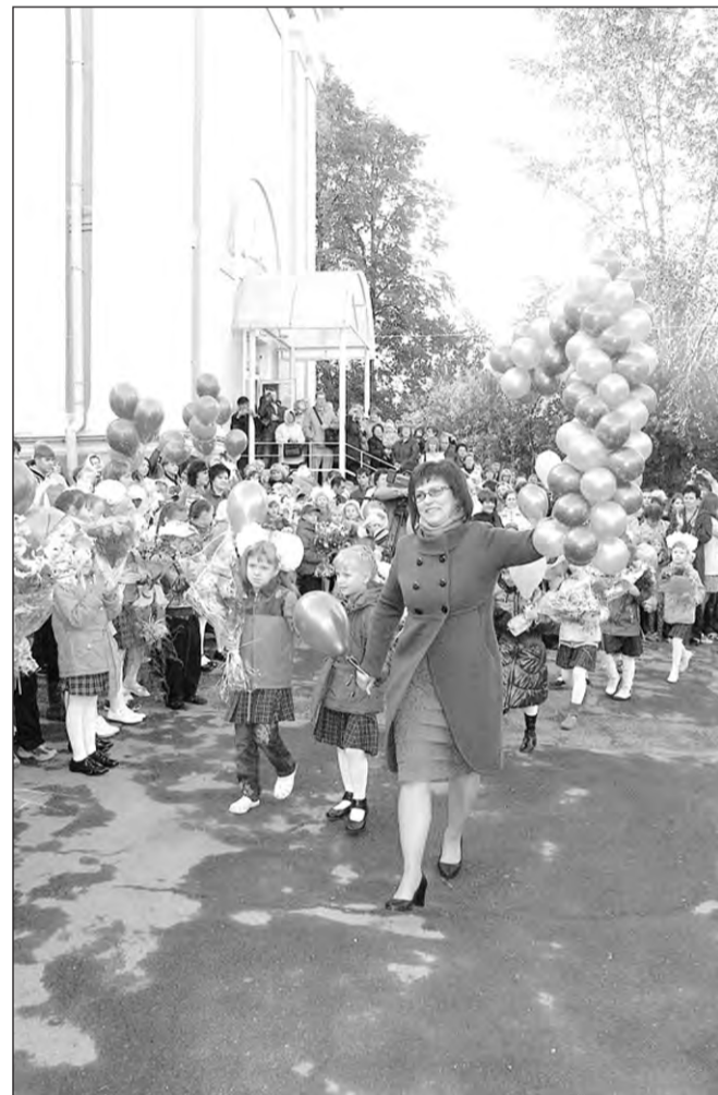
Первый раз - в первый класс. Школа № 43, 2010-й год

В СЕ образовательные учреждения Свердловской области прошли проверку и готовы к началу учебного года. Держать на контроле организацию образовательного процесса главам регионов поручил 27 августа председатель правительства Российской Федерации Дмитрий Медведев на видеоконференции, посвященной готовности к учебному году, в которой принял участие губернатор Евгений Куйвашев.