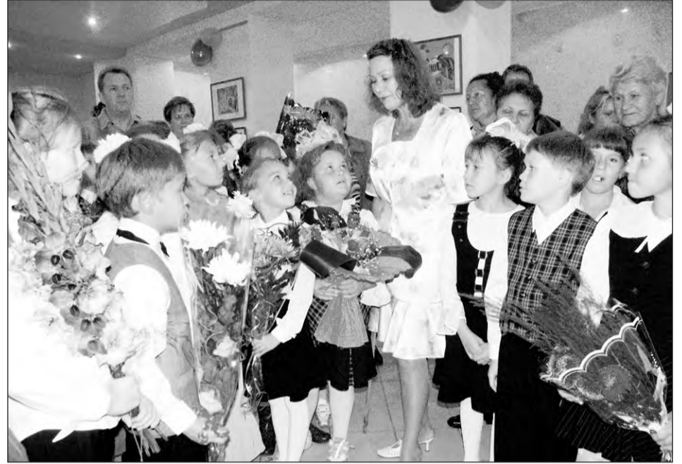
Первое сентября. Школа № 40. 2005-й год

ние у них познавательного интереса, самостоятельности, навыков здорового образа жизни.