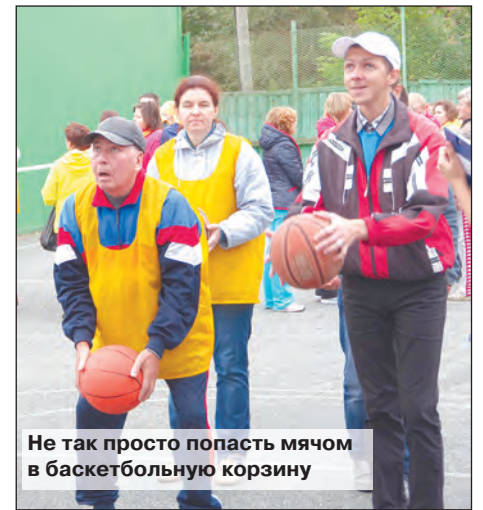
Не так просто попасть мячом в баскетбольную корзину