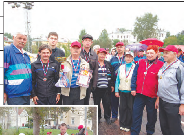
Победители соревнований - команда Новоуральск-1