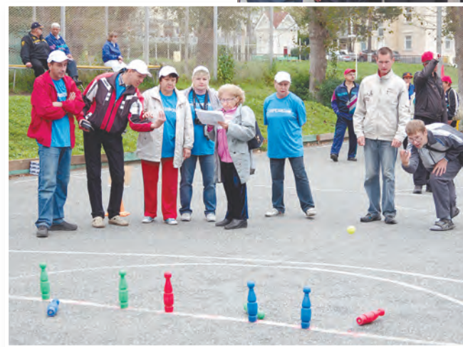
Одно из упражнений - кегли - выполняет команда Березовского