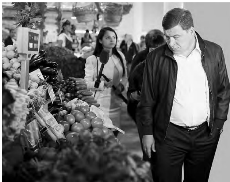
Евгений Куйвашев, губернатор Свердловской области: «Продовольственная безопасность и развитие АПК – один из приоритетов развития области. Мы понимаем, насколько важно общение, обмен практиками. Сегодняшняя встреча послужит серьезным стимулом и толчком для дальнейшего развития агропрома».

15-й агропромышленный форум и V Межрегиональная агропромышленная выставка УрФО в Екатеринбурге собрали более двухсот российских и зарубежных предприятий сельскохозяйственной, продовольственной сфер, упаковочной индустрии, оборудования для пищевой промышленности, которые представили свою продукцию.