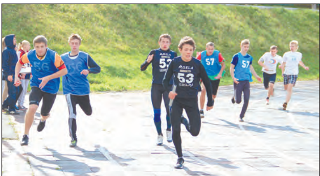
Передача эстафеты на втором этапе в забеге старшекласников

К РОТКИМ был перерыв между сорок пятой и последующей, сорок шестой, спартакиадами школ города. По традиции последних лет уже в середине сентября прошел первый вид - легкоатлетические эстафеты 4x100 м на дорожке Центрального стадиона. И снова соревнования проходили при заметном преимуществе спортсменов школы № 48, неделей раньше триумфально выступивших в «первомайско-сентябрьской» эстафете по городу. В пяти из шести номинаций бегуны шк. № 48 финишировали первыми. И хочется отметить, что все чаще начинают заявлять о себе представители некогда самой спортивной нашей школы - № 53.