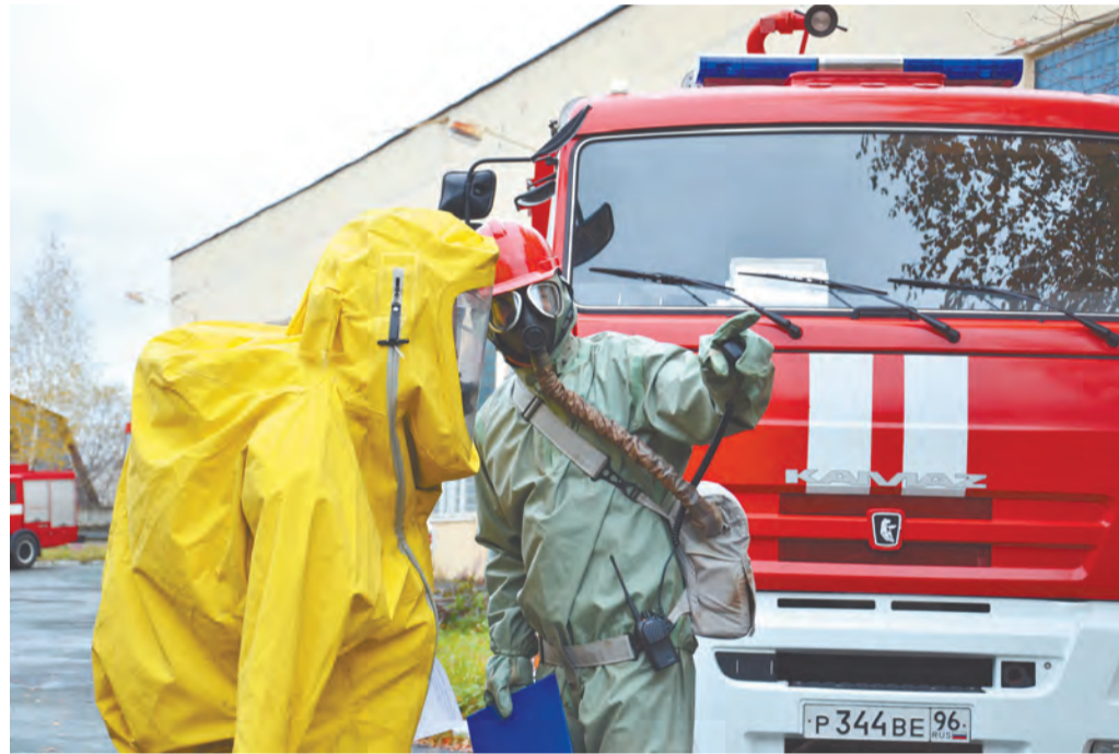
На снимке: авария на молокозаводе привела к утечке аммиака. Согласно этой легенде и действовали совместно силы отряда ГО и ЧС молокозавода и подразделения МЧС (СУ ФПС № 5). Сотрудники МЧС отработывали действия в «фантастических» костюмах повышенной защиты, похожих на скафандры. Кроме того, они задействовали роботизированный комплекс, позволяющий эффективно, без вхождения человека в опасную зону осажать пары аммиака

В условиях чрезвычайной ситуации жили новоуральцы во второй половине прошлой недели - в НГО прошёл целый ряд мероприятий в рамках Всероссийской тренировки по ГО и ЧС