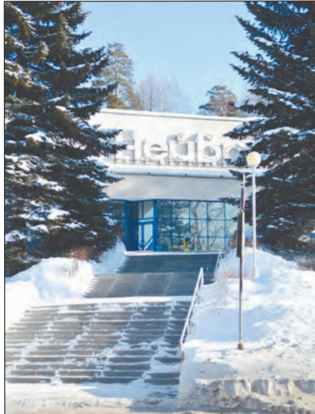
В целях повышения уровня безопасности в Новоуральске в минувшем сезоне, как и было запланировано ещё весной, возле киноцентра «Нейва» демонтирован пешеходный переход. Напомним, что причиной, подтолкнувшей к ликвидации «пешеходника», стала апрельская авария, в которой серьёзно пострадала женщина-пешеход.