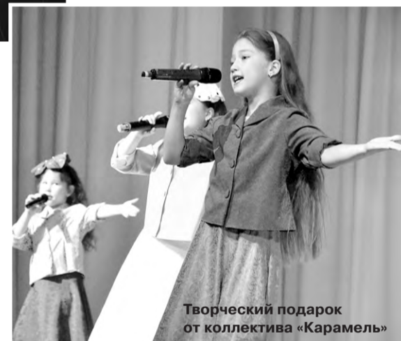
Творческий подарок от коллектива «Карамель»