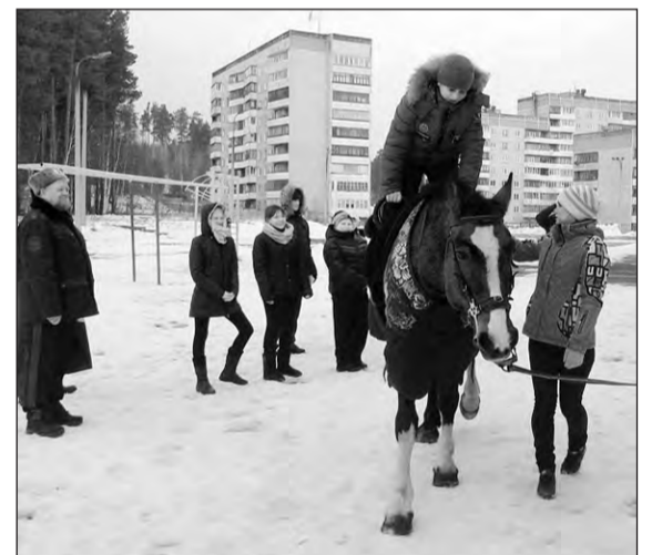
Верховой езде кадетов обучал клуб «Каприоль»