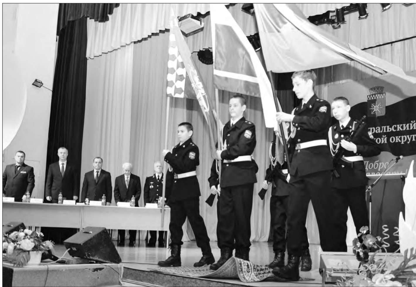
На снимке: вынос знамен кадетами военно-патриотического клуба «Рекрут»

Есть такая традиция и в Новоуральске. Обязательно приеду к вам на фестиваль «Опаленные сердца».