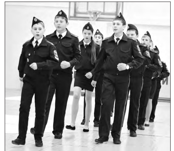
Команда школы № 4 Невьянска на смотре строя и песни

Позавчера, 12 ноября, на семинаре-совещании глав муниципальных образований ГЗУО и руководителей ветеранских организаций округа было запланировано и включено в решение проведение в 2015 году в Новоуральске слёта кадетов Горнозаводского управленческого округа.