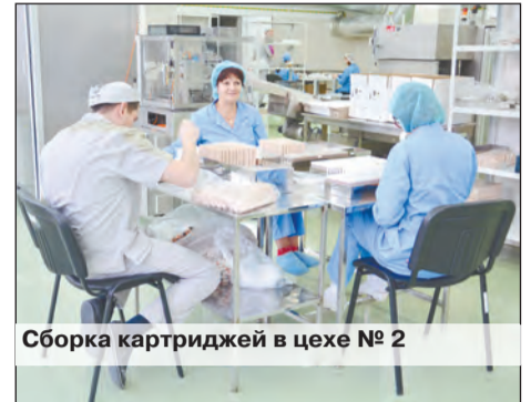
Сборка картриджей в цехе № 2

«Вся готовая продукция проходит контроль качества как в своей лаборатории, аккредитованной Росздравнад-