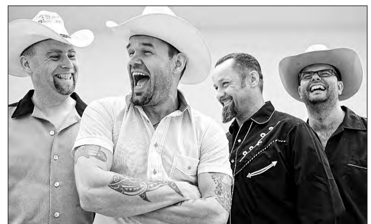
Неунывающие парни из «The Lazy Boys»