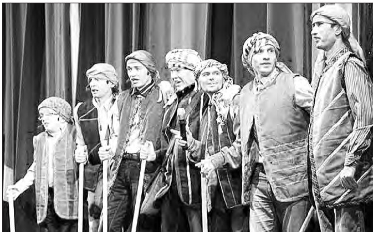
Выступление театральной студии «Благого дела»

Организаторы представления отмечают, что «Осо-