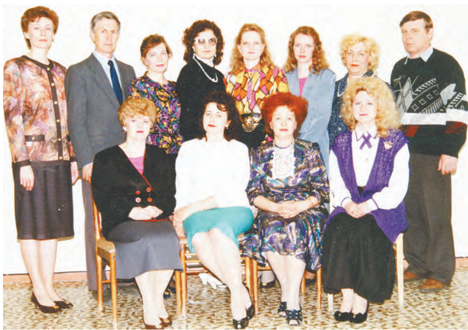
областных инспекций мы были впереди планеты всей. Некоторым из нас крупно повезло, нас поощрили турпутевками в Италию и во Францию.