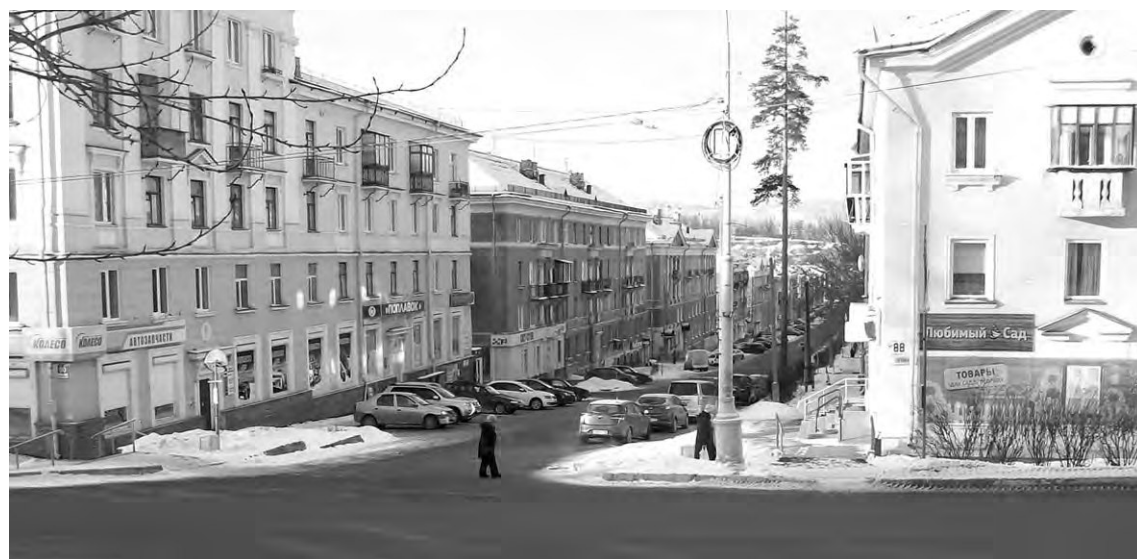
Обновлённый тротуар по улице Л. Толстого

Что касается приоритетов на перспективу, будем продолжать работы по дальнейшему благоустройству района. Есть определенные планы по ремонту проездов и установке игровых комплексов.