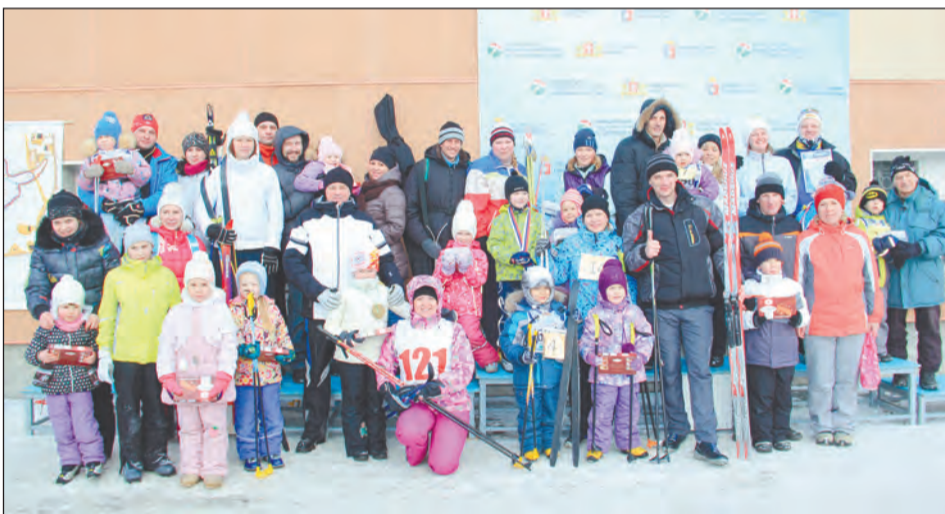
Участники семейных стартов