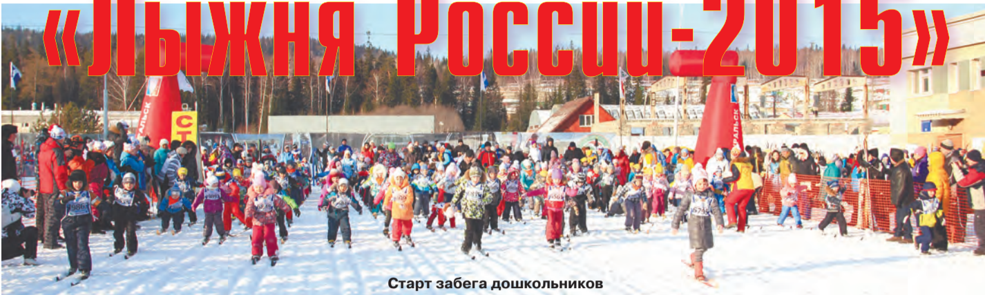
Старт забега дошкольников

Б ОЛЕЕ ПОЛУТОРА миллионов участников собрали финальные старты Всероссийских массовых соревнований «Лыжня России-2015», прошедшие в минувшее воскресенье в большинстве регионов нашей необъятной страны. А с учетом прошедших в рамках этой акции декадников и месячников лыжного спорта количество поклонников лыж в стране превысило трехмиллионный рубеж.