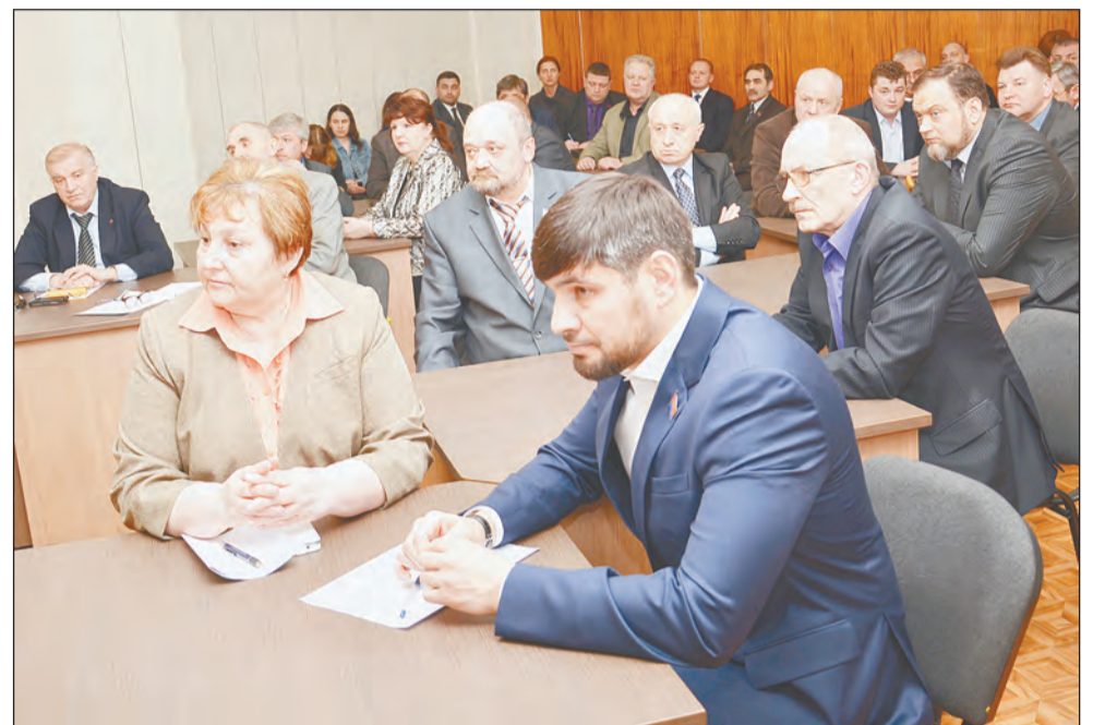
На снимках: Евгений Куйвашев и Владимир Машков во время встречи с депутатами Думы НГО