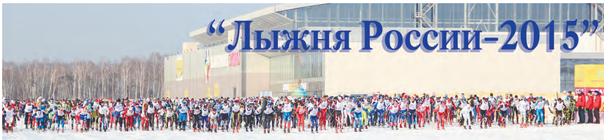
Екатеринбург-ЭКСПО - это необъятные возможности!