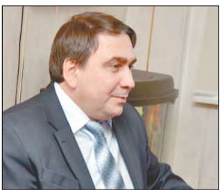
Николай СМЕРНОВ, министр энергетики и жилищно-коммунального хозяйства Свердловской области:

- Мы не преследуем цель все дома загнать в «общий котел». Наша задача - чтобы система работала и капитальные ремонты проводились - для комфортного проживания в них. И первая часть этой большой задачи - информирование жителей.