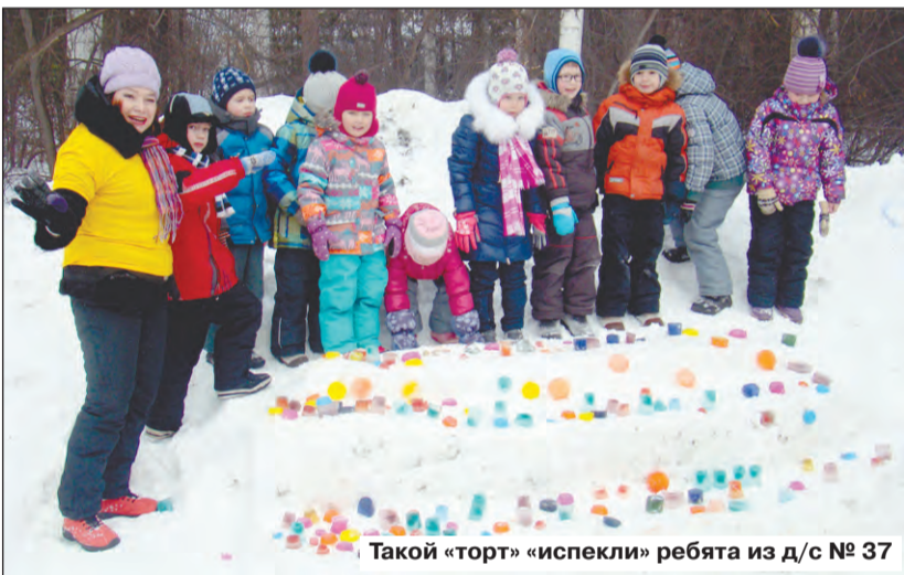
Такой «торт» «испекли» ребята из д/с № 37