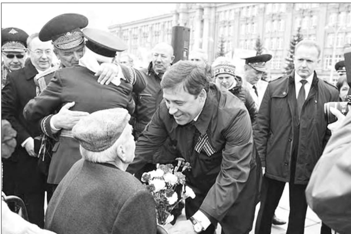
За последние пять лет свыше 5500 ветеранов Великой Отечественной войны отпраздновали новоселье. Осталось обеспечить жильём ещё 166 человек. Эта задача должна быть решена к 70-летию Победы.

«Моя хата с краю, ничего не знаю» - это не позиция уральцев. Мы - опорный край державы. Екатеринбург и Свердловская область - средоточие оборонной промышленности России. Здесь находится командный пункт Центрального военного округа, в управление которому вверена огромная территория, вплоть до южных границ страны. Поэтому и уси-