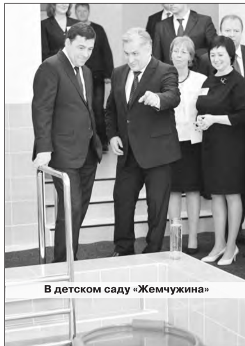
В детском саду «Жемчужина»

Как прозвучало в ходе окружного совещания с главами муниципальных образований Горнозаводского округа, в 2014 году за счет всех источников финансирования на территории окру-