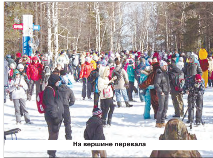
На вершине перевала

На перевале их ждали массовики-затейники с различными конкурсами, концертная программа, вкусная каша (на снимке) и горячий чай. И хотя чая всем не хватило, количество собравшихся на границе Европы - Азии превысило самые смелые ожидания организаторов, народ был весьма доволен.