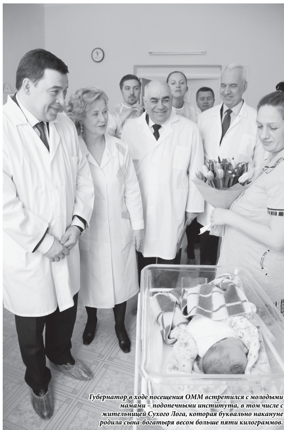
Губернатор в ходе посещения ОММ встретился с молодыми мамами – подопечными института, в том числе с жительницей Сухого Лога, которая буквально накануне родила сына-богатыря весом больше пяти килограммов.

Исправить ситуацию помогут передвижные мобильные комплексы, которые будут работать в территориях. Сейчас приобретены 5 таких автомобилей: в Первоуральске, Нижнем Тагиле, Ирбите, Каменске-Уральском и Краснотурьинске. В ближайшее время предстоит оснастить их необходимым оборудованием для оказания первичной помощи в мобильном варианте.