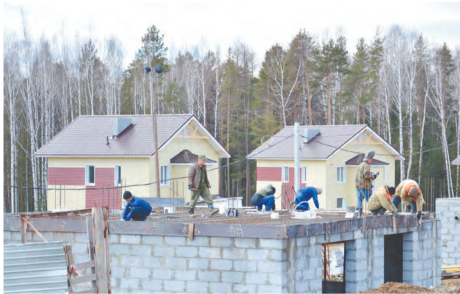
Растут коттеджи в Южном районе. По программе жилищного строительства город делает ставку на малоэтажную застройку

По программе «Развитие ЖКХ и повышение энергетической эффективности в НГО» планируется построить: вторую очередь уличного газопровода в селе Тарасково, обеспечив возможность подключения 219-ти домов; трансформаторную подстанцию, а также реконструировать электросети в сельских населенных пунктах. Продолжится реконструкция системы электроснабжения МКР-2, где, согласно плану, будут введены в эксплуатацию сети 0,4 кВт. Завершится капитальный ремонт дома № 8 по улице Садовой - жильцы смогут вернуться в свои квартиры.