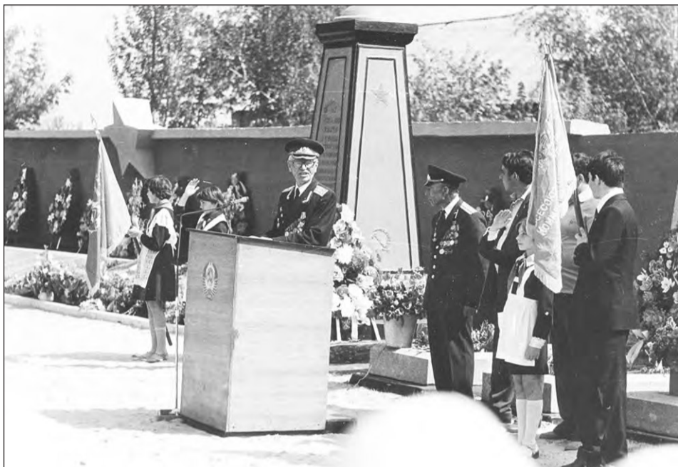
Праздничный митинг в честь 9 Мая у мемориального комплекса села Красный Оскол, 1984 г.