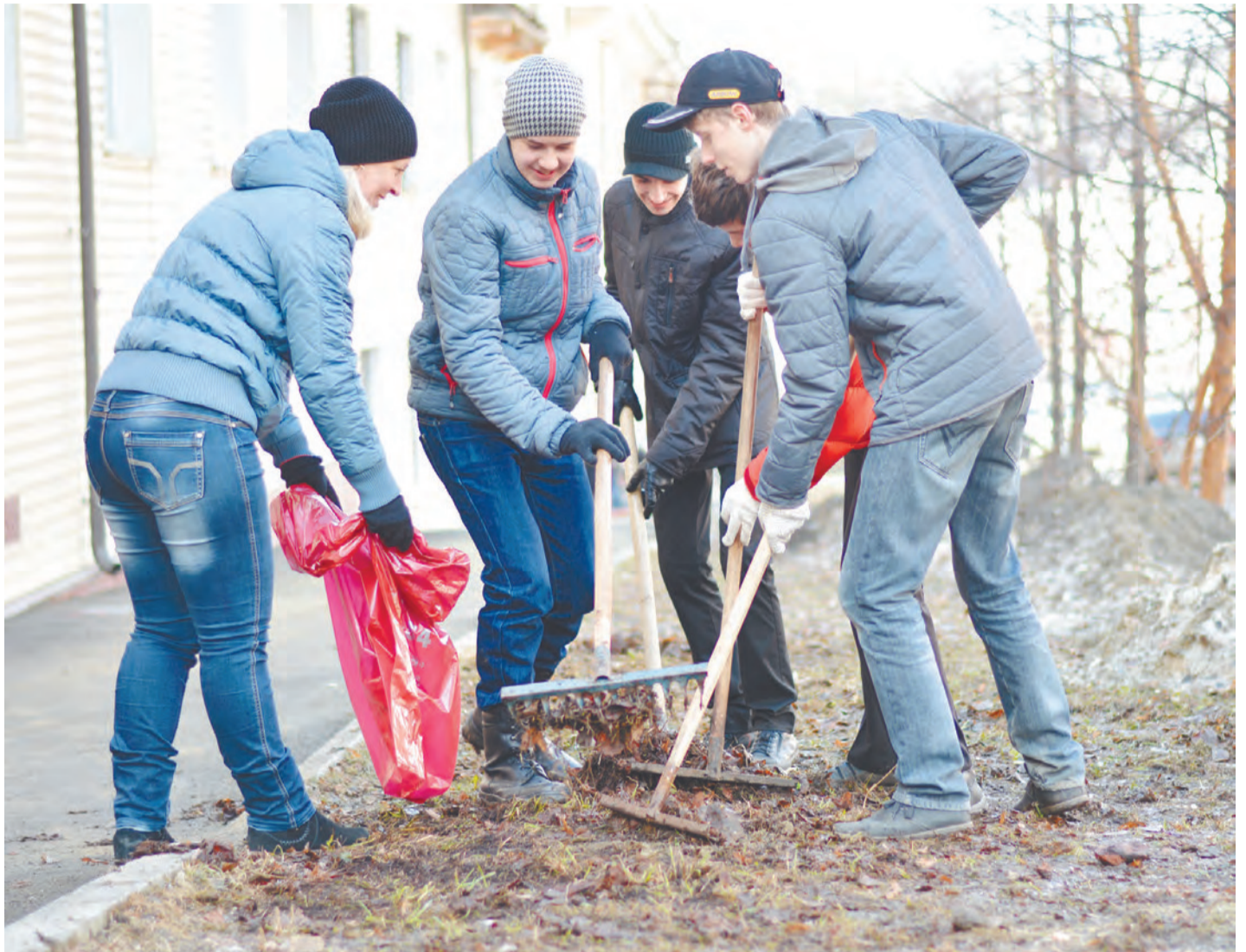
Задачей девятиклассников школы № 45 было очистить от мусора газоны вдоль улицы Свердлова. Справились! Молодцы!

19 ОРГАНИЗАЦИЙ и предприятий города, по данным Управления городского хозяйства на 21 апреля, уже сказали: «Нет - мусору!», взяли в руки грабли и метлы и почистили город. В числе этих организаций как муниципальные учреждения, так и частные компании и общественные объединения. Надо отдать должное неравнодушию тех, кто выходил на борьбу с мусором не по разу. О высокой активности новоуральцев говорят и в Дорожно-коммунальной службе, обеспечивающей горожан инструментами и мешками. Только за период с 13 по 18 апреля с территорий НГО службой было вывезено 615 тонн