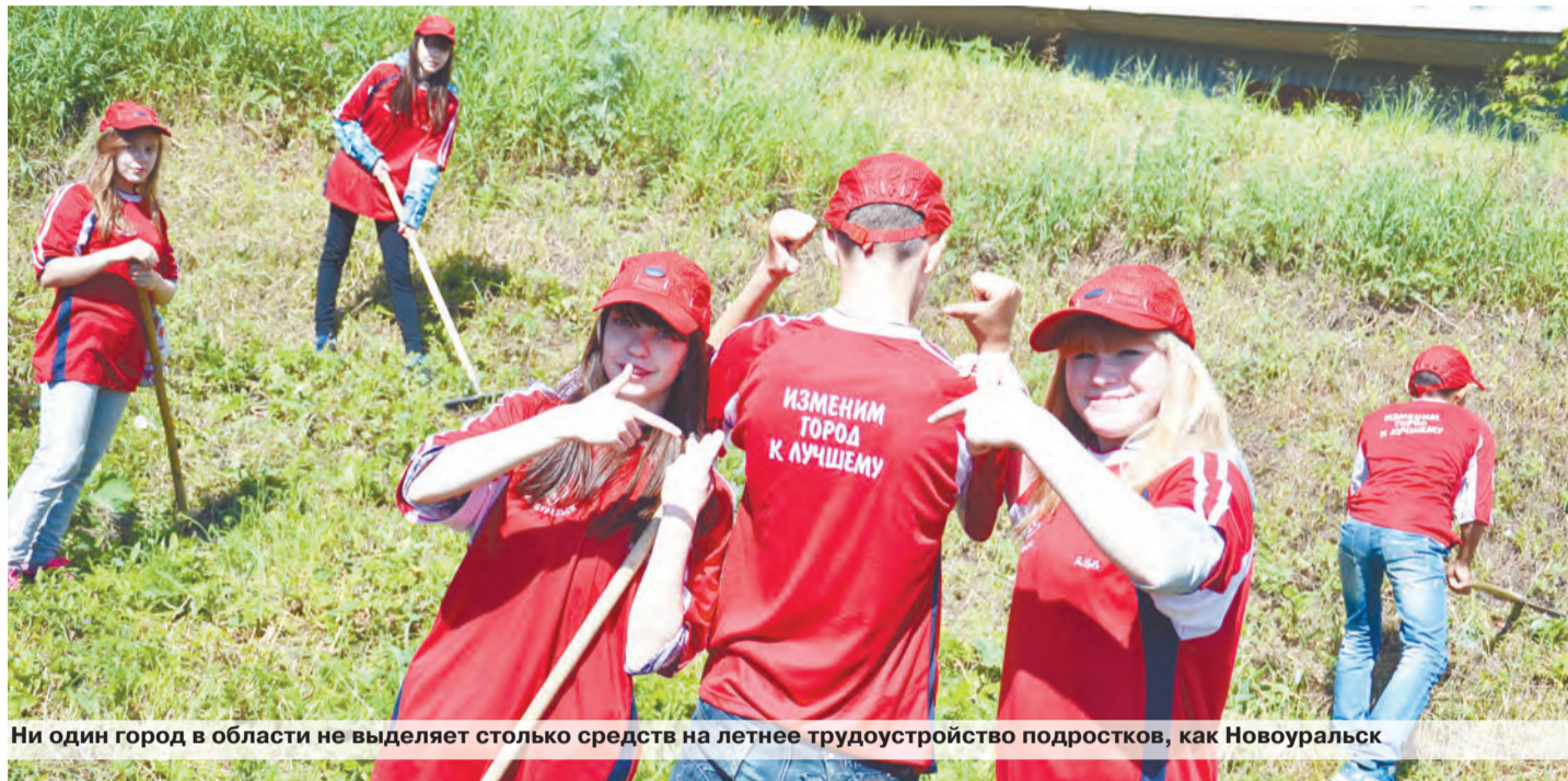
Ни один город в области не выделяет столько средств на летнее трудоустройство подростков, как Новоуральск

- актуализируют в ходе исполнения бюджет текущего, так, в 2014 году в документ внесено 8 изменений;