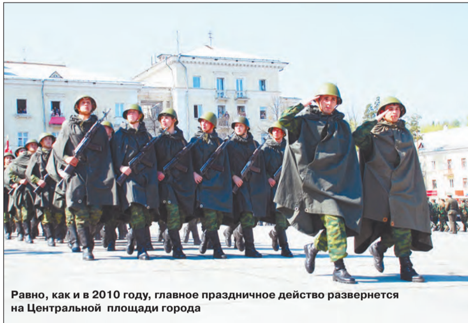
Равно, как и в 2010 году, главное праздничное действие развернется на Центральной площади города

- Мы решили провести торжество, основываясь на опыте пятилетней давности: формат, в котором город отметил 65-летие Победы, понравился многим, мы получили тогда массу положительных откликов. Торжества начнутся 8 мая - по всей стране будет отмечаться День памяти. К Вечному огню возложат цветы коллективы му-