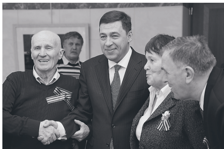
«Всеми своими успехами, своей высокой репутацией, надежной основой и хорошими перспективами будущего роста Свердловская область обязана таким семьям, как ваши. Трудовые династии – это опора Урала, та среда, где закладываются нравственные ценности, семейные, рабочие, патриотические традиции. Наша общая задача – не только сохранить славные традиции действующих трудовых династий, но и создать условия для появления новых», – сказал Евгений Куйвашев.

По семейным летописям и архивам уральских династий можно писать историю становления и развития российской металлургии, машиностроения, энергетики, земледелия, здравоохранения, науки, культуры, спорта. Но чтобы появлялись новые династии, необходимо создавать условия. Об этом губернатор Евгений Куйвашев сказал на очередной встрече с представителями трудовых династий Свердловской области.