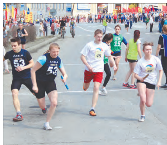
Практически во всех забегах соперничали между собой три школы №№ 53, 48 и 49

Если два года назад стартовала 21 мужская команда, то ныне их осталось восемь. Практически не представлены коллективы физкультуры теркома, за исключением сборных Управления образования.