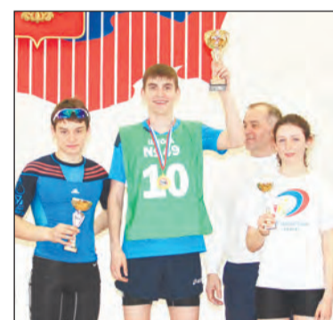
Лучшие школы в командном забеге - №№ 53, 49 и 48