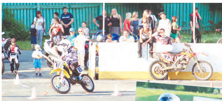
«Мотоджимхана» - это фигурное вождение, виртуозное владение мотоциклом, точный расчет и безупречная техника, что и продемонстрировали два десятка гонщиков

В программе традиционного праздника молодежи было много спорта, экстрима и экзотики, что полностью отвечает интересам молодого поколения горожан. Пляжный волейбол и стритбол, соревнования по фигурному вождению мотоциклов «Мотоджимхана» и главная фишка спортивной части праздника (выступление гостей из Екатеринбурга) - экстремальное велошоу «Гравити» - в нашем фоторепортаже.