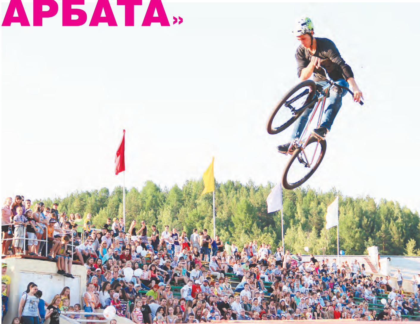
Велоспорт на грани экстрима: головокружительные трюки от команды «Gravity» (Екатеринбург) привели публику в восторг

Скептики не верили в успех, в соцсетях заранее критиковали организаторов. Но День молодежи-2015 в Новоуральске превзошел все ожидания! Тысячи молодых людей, десятки творческих площадок, яркие концертные номера и настоящие звезды столичной сцены. Та-ким запомнится этот праздник.