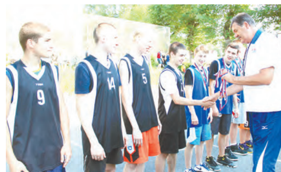
Стритбол - модное течение баскетбола в формате 3х3 - это динамика, это точные броски, это ярко выраженная жажда борьбы! Стритбол стал самым массовым спортивным действием, в котором участвовало 19 команд