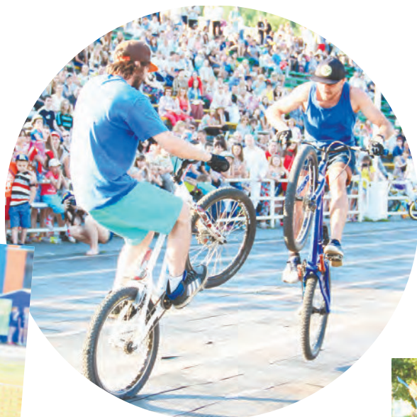
Гвоздь программы спортивной части праздника - выступление экстремального велошоу «Гравити» (Екатеринбург). Поединки один на один, головокружительные прыжки, сальто в воздухе и другие смертельные номера