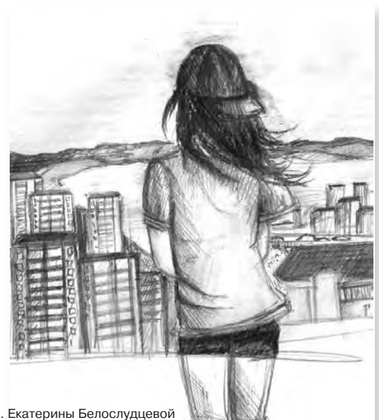
Рис. Екатерины Белослудцевой

То, что было, уже когда-то прошло, Ты, давай, малыш, не грусти, Выброси из головы все ненужное барахло. Держись, там весна сгущает краски, Мы от потепления снимем маски, Здравствуй!