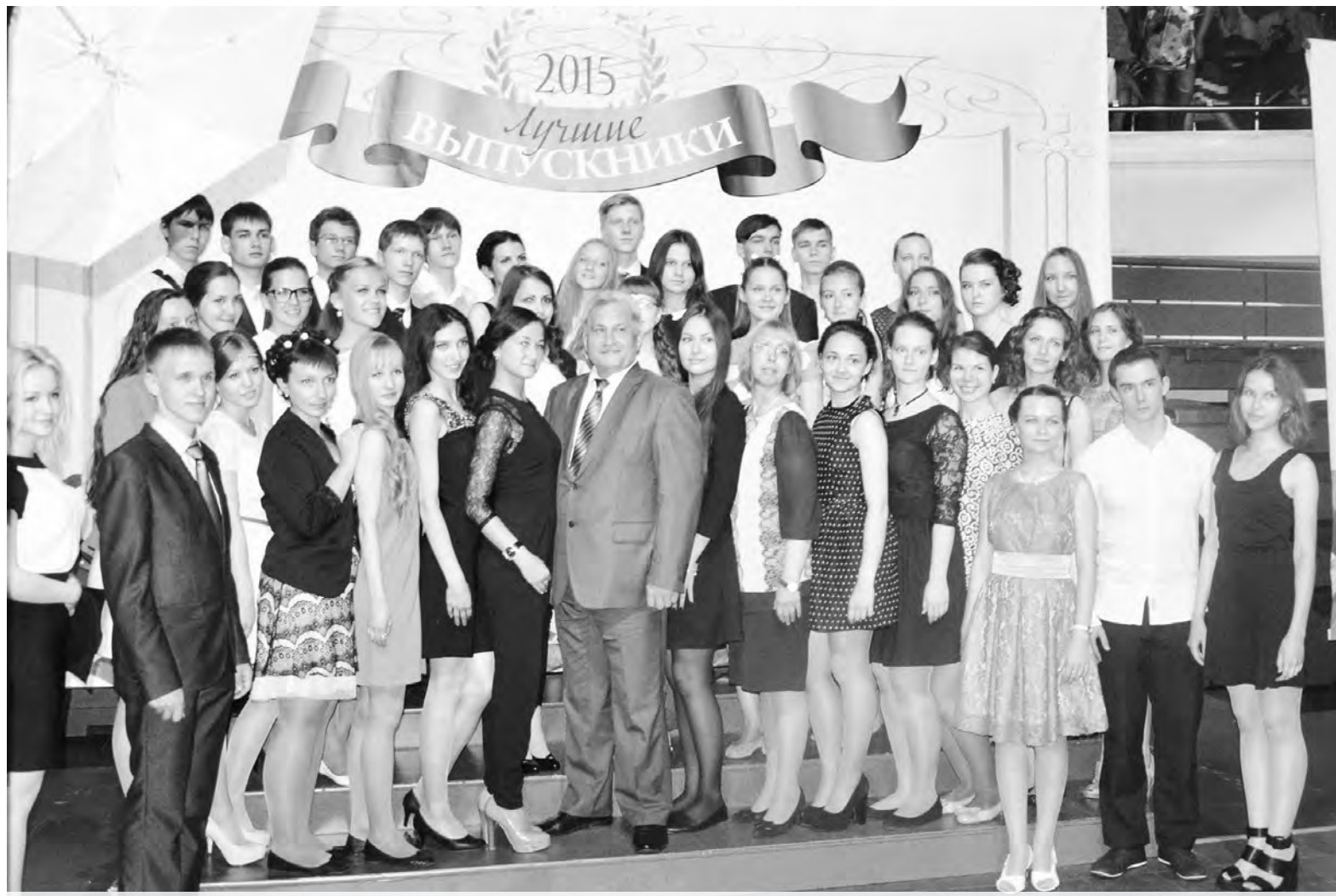
Делегация медалистов из Новоуральска была вторая по численности после Екатеринбурга

- Каждый из выпускников-отличников добился успеха, высоких результатов своим собственным трудом. Я уверен, что каждый из них определится с тем, по какому пути идти дальше, какой выбрать вуз. А золотые медали, которые они получают, станут для них дополнительной помощью в достижении цели, - сказал