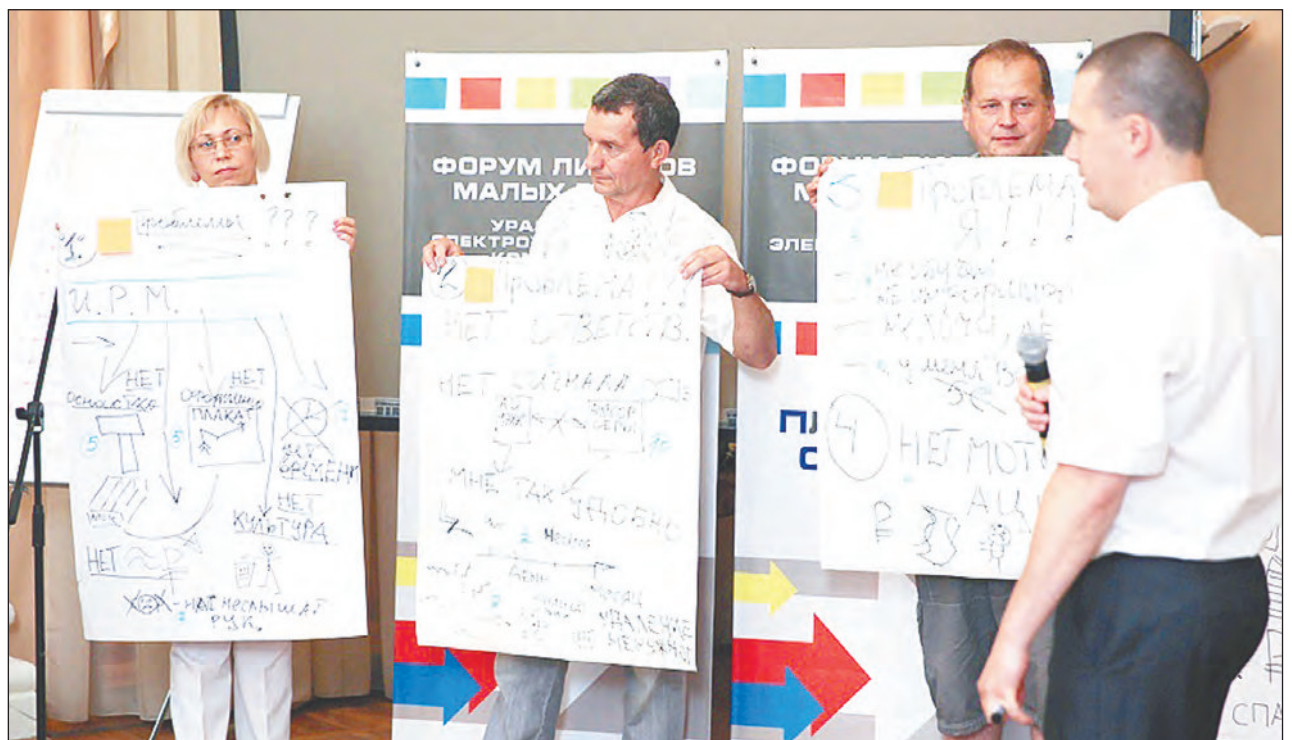
Презентация одной из команд форума

- На УЭХК я начинал вакуумщиком 14 лет назад после нашего техникума. Позднее закончил Уральский экономический университет: знаний много не бывает. В принципе я продолжаю трудовую династию: в свое время на УЭХК работали мои мама и отец, сейчас - на заслуженном отдыхе. Я, как и мои родители, стараюсь хорошо делать свою работу. Коллегам желаю добиваться большего, стремиться к лучшему и верить в будущее!