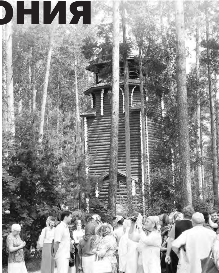
Паломники возле одного из семи храмов исторического комплекса Ганина Яма