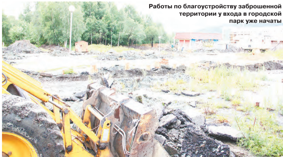
Работы по благоустройству заброшенной территории у входа в городской парк уже начаты