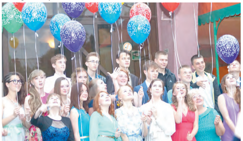
9 «Б» класс гимназии Наш выпускной - он один такой! Мы смотрим вверх, нас ждёт успех!