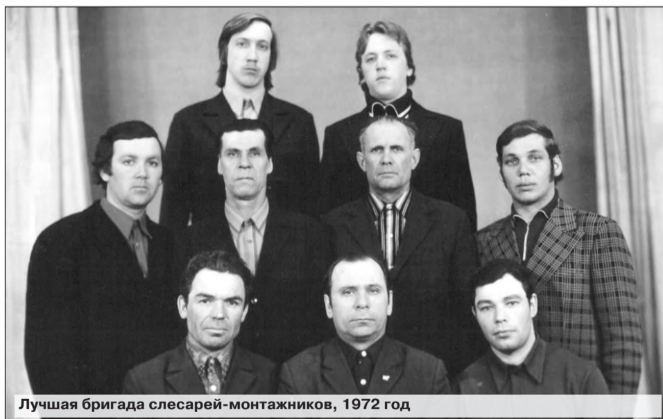
Лучшая бригада слесарей-монтажников, 1972 год

В далекие 40-50-е годы первостроителям, разумеется, приходилось нелегко: из орудий труда - кирка, лопата, носилки, тач-