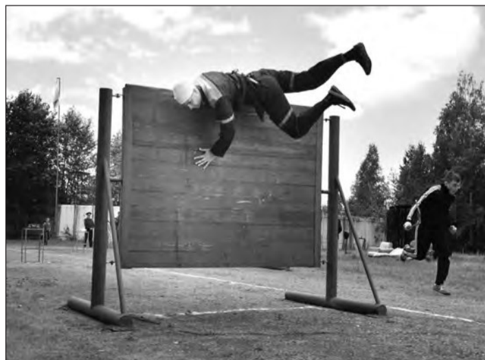
На этапе преодоления забора - команды ООО «ТЛЦ» и цеха 87

нужно преодолеть препятствия и потушить огонь различными типами огнетушителей, песком и при помощи пожарного крана. В итоге третье место - у команды цеха 101. Второе — у цеха 87. Ну а лучшим из лучших второй год подряд стал цех 19. Более того, дружина 19-го побил рекорд цеха 101, продержавшийся пять лет, установив новый - 1 мин. 22,05 секунды.