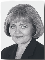
Людмила Бабушкина, председатель Законодательного Собрания Свердловской области:

Завершилась весенняя сессия областного парламента, в заседаниях объявлен перерыв. Депутаты выполнили намеченные задачи по законодательной поддержке «майских указов» Президента РФ и других стратегических документов, определяющих стратегию развития России и Свердловской области.