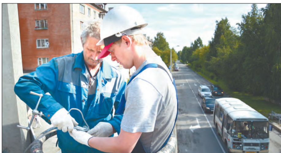
Установку видеокамер на перекрестке Комсомольская - Победы ведёт компания «Тукор»