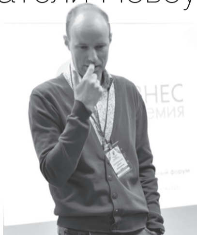
платные курсы по основам предпринимательства.

Второй - работа с начинающими и теми, кто хочет стать предпринимателем. В этом году мы провели два марафона «Начни свое дело», где суммарно почти 40 человек прошли бес-