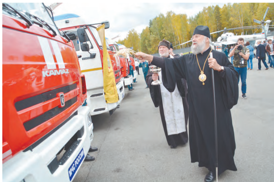
На площадке МЧС побывал епископ Нижнетагильский и Серовский Иннокентий. Владыка освятил восемь новеньких пожарно-спасательных автомобилей, переданных областным подразделениям МЧС.

Посмотрели яркую церемонию открытия. Увидели примеры действия образцов военной техники. Оценили масштабную инсценировку боевой операции по уничтожению крупной группировки боевиков. Побывали на пленарном заседании по развитию военно-промышленного комплекса России в условиях санкций и обострённой политической обстановки. Самое зрелищное - на фото. Самое актуальное - в монологах от главных действующих лиц.