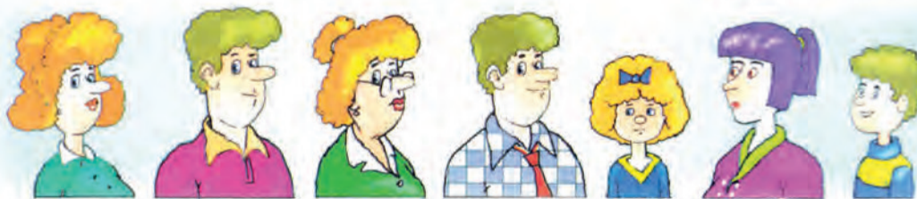
Мама, папа, бабушка, дядя, племянница, соседка, брат.