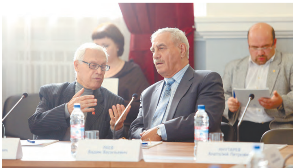
Участники форума-диалога обсуждают перспективы развития ЗАТО

Под таким тезисом по инициативе АО «УЭХК» при участии руководителей Топливной компании «ТВЭЛ» и первых лиц города и комбината прошел Гражданский форум-диалог. В зале заводоуправления собрались представители власти, депутаты Думы, почетные граждане города, члены общественных организаций и Ассоциации предпринимателей.