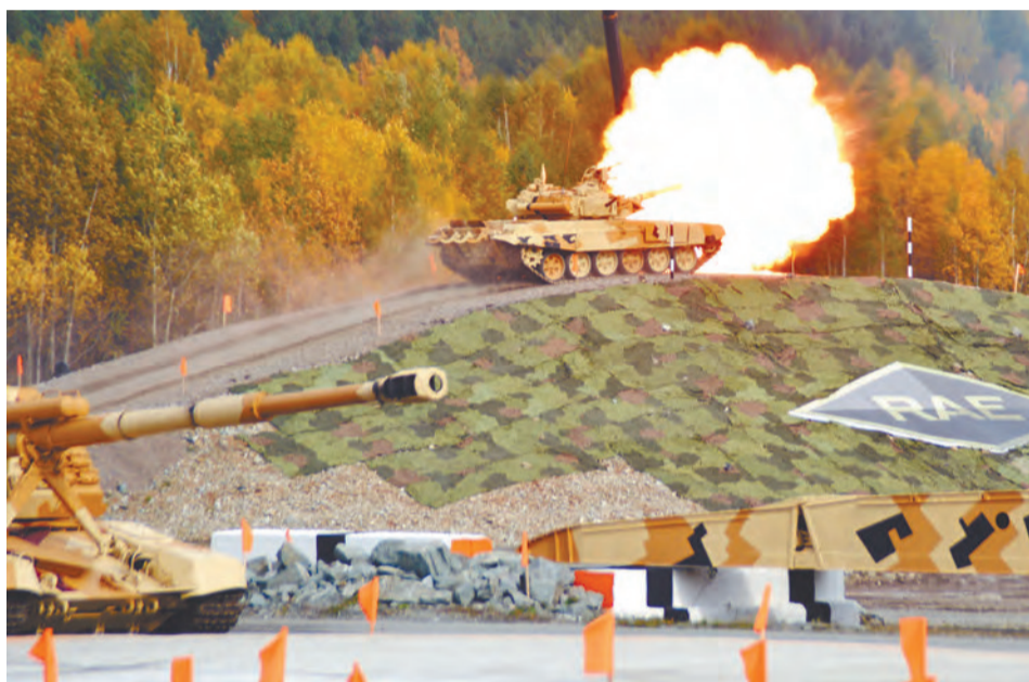
Примерно в течение сорока минут на полигоне вершился театр военных действий, в ходе которого настоящую «саудовскую аравию» устроила террористам наша современная боевая техника

Делегации из 65 стран мира побывали на RAE-2015. В том числе и делегация из Саудовской Аравии - страны, которая намерена возобновить сотрудничество с Рособоронэкспортом после многолетней паузы.