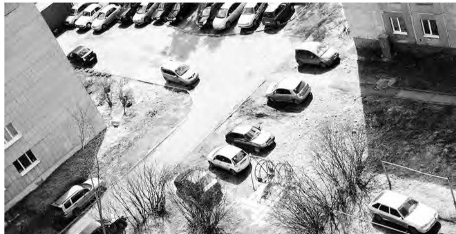
В наших дворах мало парковок. Поэтому люди вынуждены парковать свои автомобили на газонах

14 сентября комиссия по социальной политике рассмотрела вопрос «О состоянии медицинского обслуживания населения НГО». Кардинальных подвижек в решении проблем новоуральской медицины отмечено не было. Корень всех зол кроется в кадровом голоде, из-за этого и очереди, и невозможность попасть к узким специали-