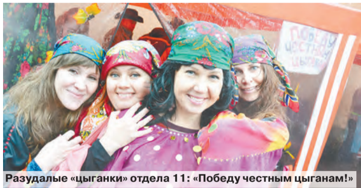
Разудалые «цыганки» отдела 11: «Победу честным цыганам!»

Каков же исход поединка, спросите вы. А проигравших не было: победили дружба и единение. Главное, что праздник, который затевали все вместе, получился хорошо подготовленным: в достатке оказалось и соли, и перчика, и радости с юмором пополам. В общем, хватило, чтобы зарядиться позитивом и отличным настроением. Расхвалились все сытые и довольные. А что еще надо в субботний выходной?!