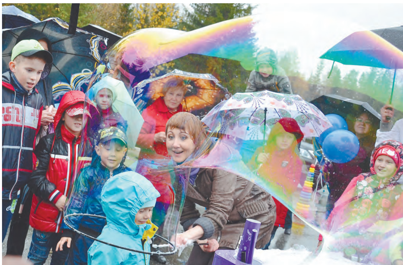
Одним из самых ярких событий для маленьких жителей города на этом празднике стало шоу мыльных пузырей от «Солнцепарка»

Широко и душевно отметили атомщики свой профессиональный праздник, а также 70-летие атомной отрасли. Три дня Новоуральск жил в напряженном, но радостном ритме: встречи со звездами эстрады, концерты, спортивные соревнования и конкурсы надолго останутся в памяти горожан.