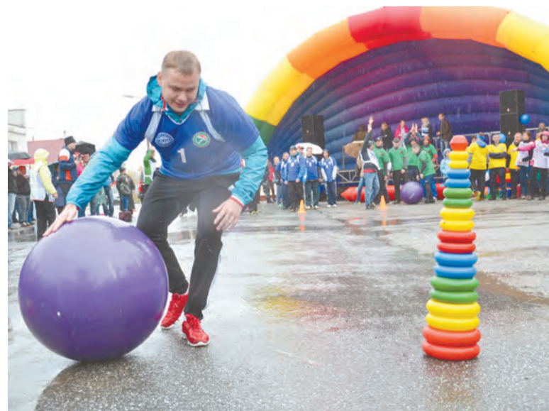
Разворот подготовили Жанна КАЛУГИНА, Евгений СЕРЕБРЯКОВ.

В итоге спортивные баталии под дождем завершились победой отдела 10, второе место заняла команда Управления, третье разделили представители цеха 101 и отдела 18. Всем были вручены почетные грамоты и кубки. Зрители и участники «Больших гонок» получили отличный заряд позитива и бодрости!