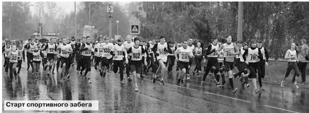
Старт спортивного забега

Всего в этот день в забегах приняли участие две с половиной тысячи горожан, а вместе с декадой бега участниками «Кросса Нации-2015» стали 16215 новоуральцев.