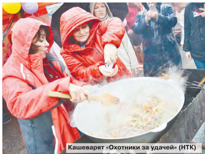
Кашеварят «Охотники за удачей» (НТК)

Однако все с нетерпением ждут большой дегустации. Жюри «Кулинарного поединка» во главе с генеральным директо-