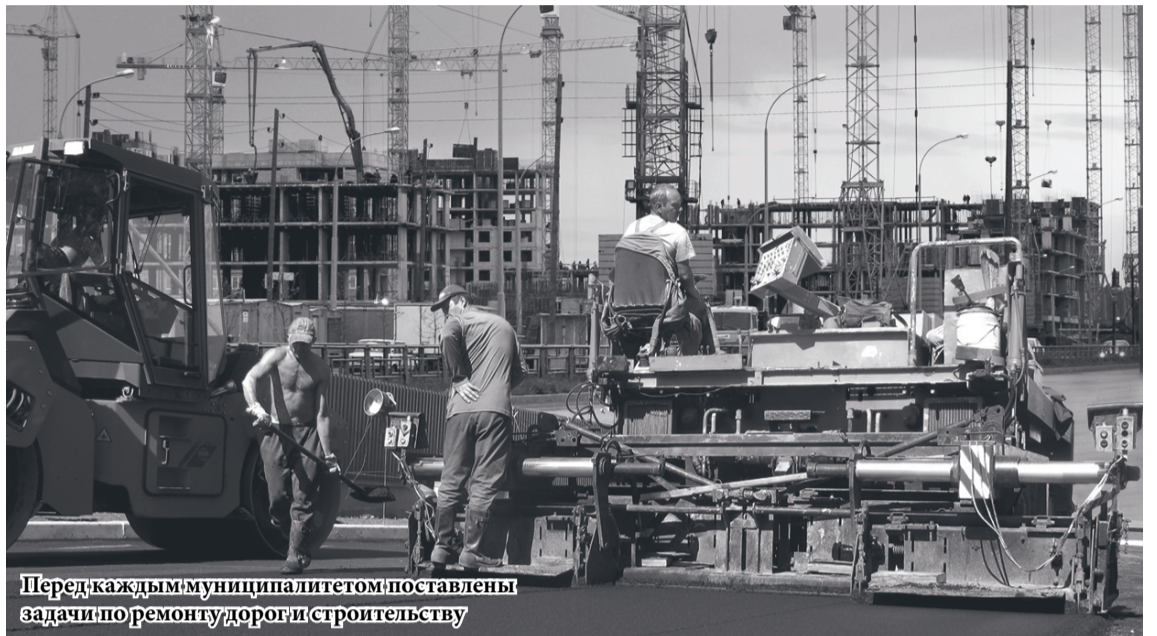
Перед каждым муниципалитетом поставлены задачи по ремонту дорог и строительству

«Это значит, что снижение доходного прогноза территорий при балансировке будет компенсировано из областного бюджета субсидиями и дотациями, – отметила министр финансов области Галина Кулаченко. – Кроме того, не совсем корректно сравнивать общую сумму заявленной потребности муниципалитетов с итоговой. Ведь еще на старте согласительных процедур мы договорились о том, что в сегодняшней экономической ситуации должны быть выделены и обоснованы самые основные проблемы, требующие дополнительного финансирования».