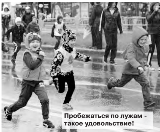
Пробежаться по лужам - такое удовольствие!