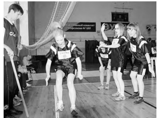
«Гигантский прыжок» команды «Улыбка»