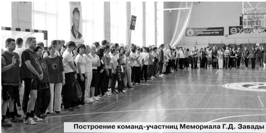
Построение команд-участниц Мемориала Г.Д. Завады