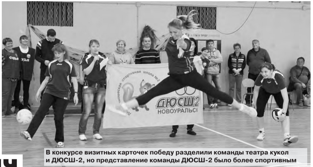
В конкурсе визитных карточек победу разделили команды театра кукол и ДЮСШ-2, но представление команды ДЮСШ-2 было более спортивным

Итоги соревнований, прошедших в минувшую субботу, еще подвоятся и уточняются. По предварительным подсчетам, в тройке призеров среди женщин - команды с/к «Кедр», школы № 40 и «Администрация-1», а среди мужчин - сборная школы с. Тарасково и школы № 49, ДЮСШ-4 и команда школы-интерната № 53.