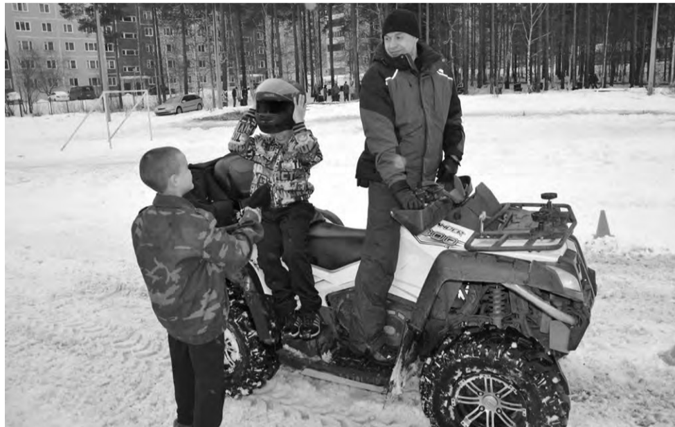
На школьном стадионе режут квадроциклы

Закончившие маршировать команды спешат в тир: там уже вовсю идет инструктаж - перед стрельбами необходимо продемонстрировать свои навыки в умении разбирать собирать оружие. Ну, это самое, пожалуй, любимое занятие подростков - хлебом не корми, дай чего-нибудь растащить на запчасти! Тем не менее лица у всех сосредоточенные, понимают, что автомат в руках - не игрушка.