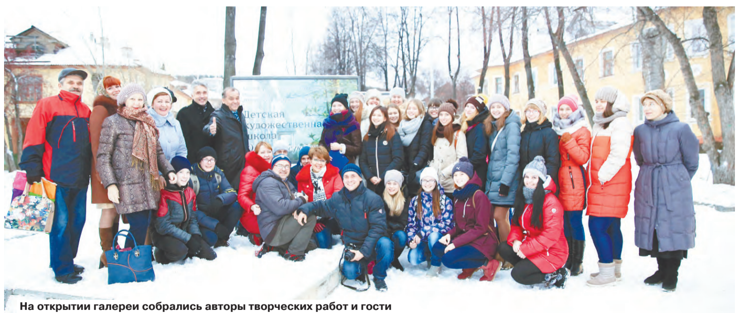
На открытии галереи собрались авторы творческих работ и гости

уральска. Работы, представленные в формате галереи под открытым небом, смогут увидеть все горожане, а также гости города. В целом выставочный комплекс - наглядное свидетельство высокой духовности и культуры новоуральцев.