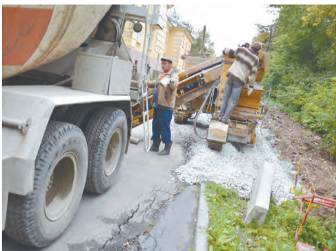
700 рублей - примерная стоимость ремонта квадратного метра дорожного покрытия. 1600 рублей - примерная стоимость квадратного метра при расширении внутридворового проезда.