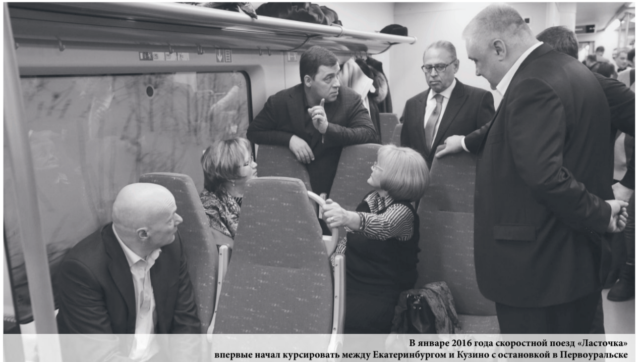
В январе 2016 года скоростной поезд «Ласточка» впервые начал курсировать между Екатеринбургом и Кузино с остановкой в Первоуральске