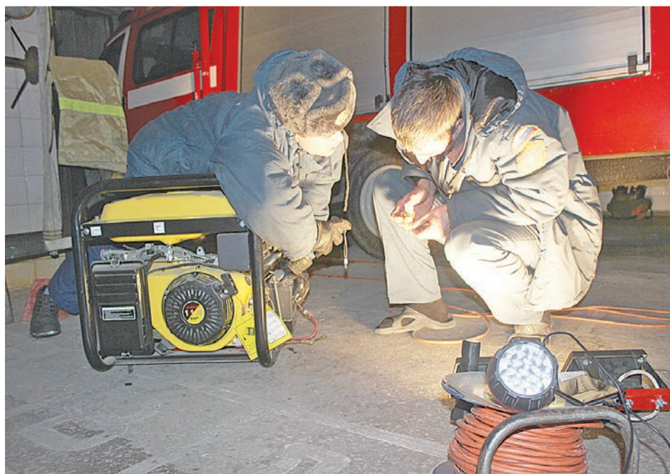
Сотрудники МЧС готовят генераторы для детского дома и «Заботы»

На селекторном совещании у главы города все руководители докладывали о стабилизации обстановки — освещение есть, отопление есть, есть небольшие завоздушивания стояков, но это устранимо, руководитель Управления образованием доложила, что в садиках и школах