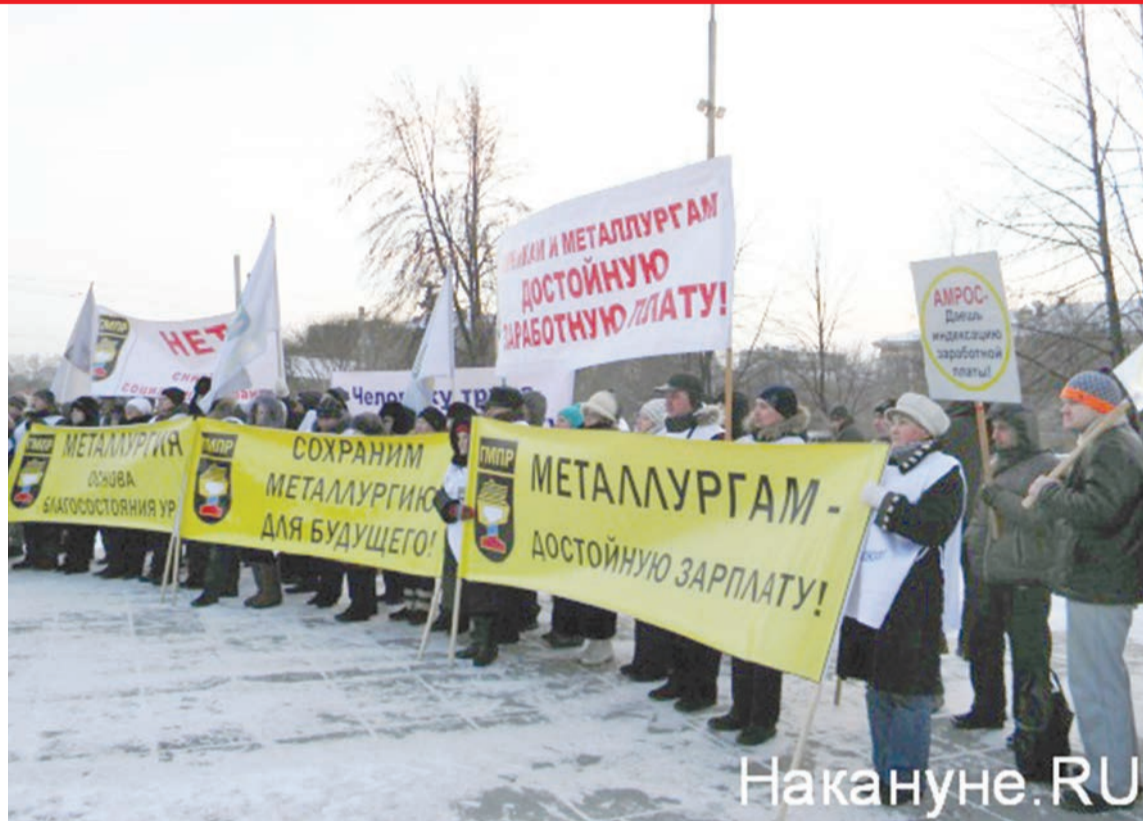
Металлурги требуют достойную зарплату

Кроме этого, было предложено в течение года повысить зарплату еще не менее чем на 8%, таким образом, должно быть достигнуто четырехкратное соотношение зарплат и прожиточного минимума. Работодатель, в свою очередь, выступает за индексацию средней зар-