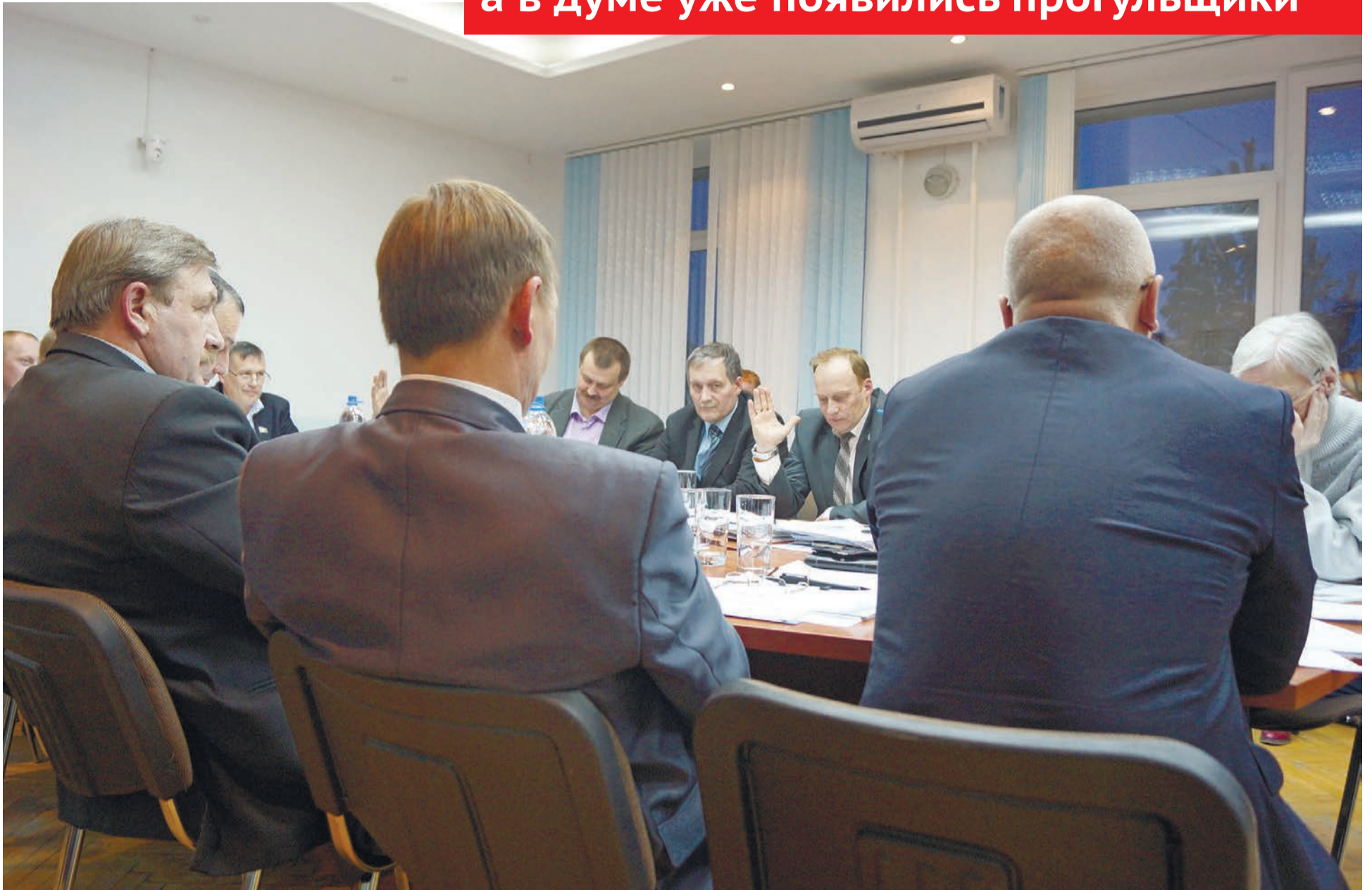
Депутаты принимают бюджет. Кворум есть!

После выборов прошло всего 4 месяца, а в думе уже появились прогульщики