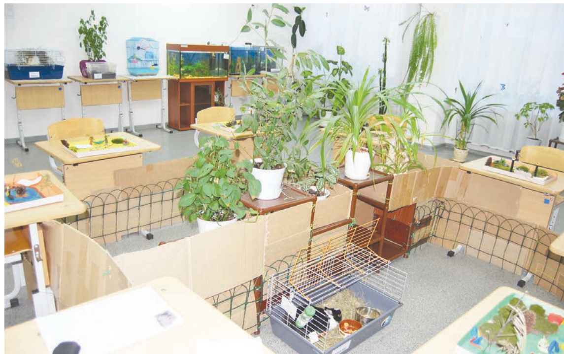
Островок живой природы в школе

Хочется, чтобы такое полезное дело развивалось дальше, и в школьном мини-зоопарке появлялись новые обитатели. Идей у педагогов много, одна из них завести парочку перепелов, чтобы наблюдать, как они высидивают, выводят птенцов, интересно поют. Может быть, кого-то из детей такое наблюдение за животными натолкнет на мысль стать зоологом.