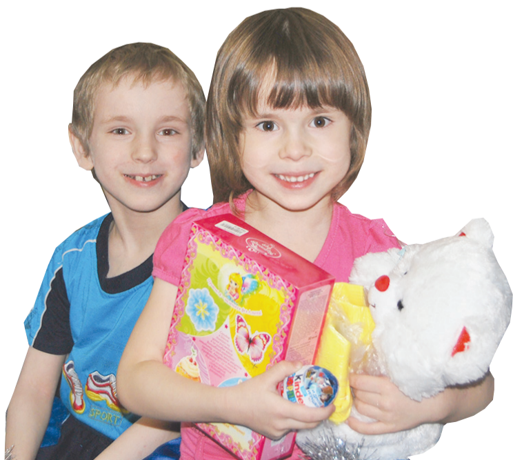
Такие искренние эмоции можно увидеть только у детей