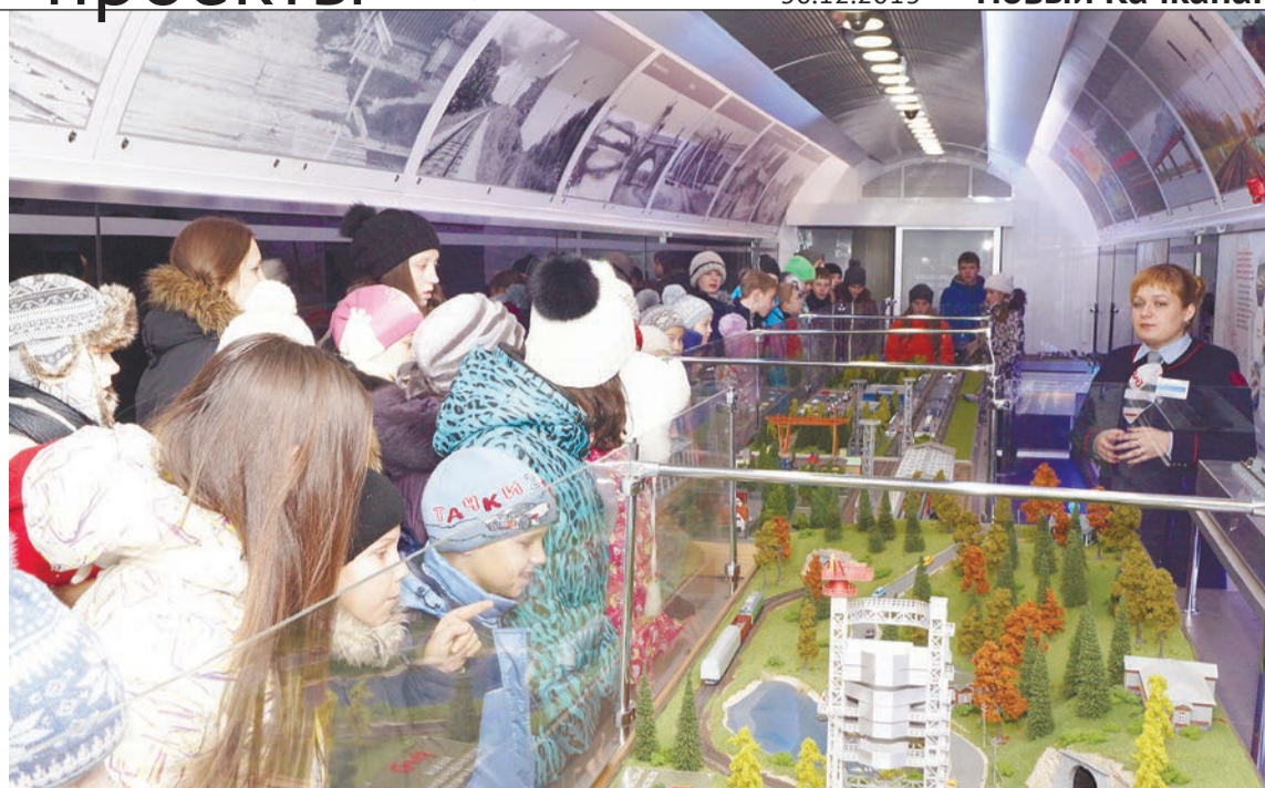
В декабре качканарцам удалось посетить передвижной выставочно-лекционный поезд ОАО «РЖД»

Связь «Роскосмоса» с железными дорогами представлена в вагоне «Инфраструктура РЖД». На