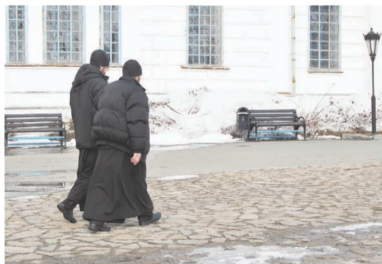
Послушники на территории Свято-Николаевского мужского монастыря