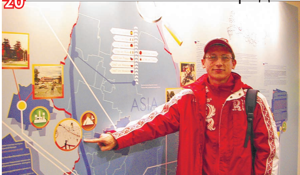
Качканар на карте России