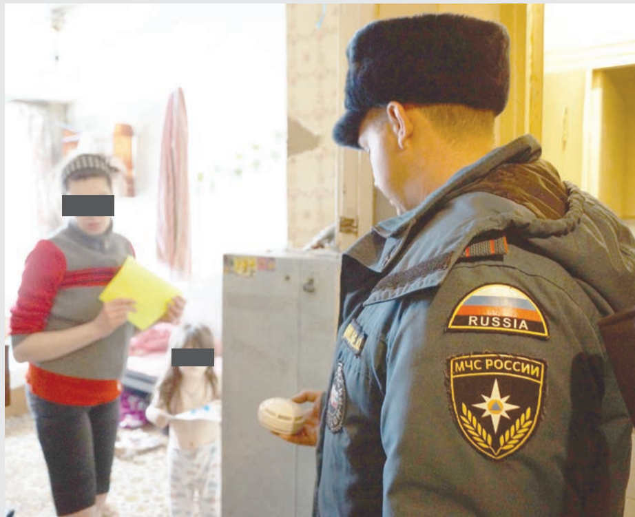
Для безопасности пожарные рекомендовали семье купить автономные пожарные извещатели