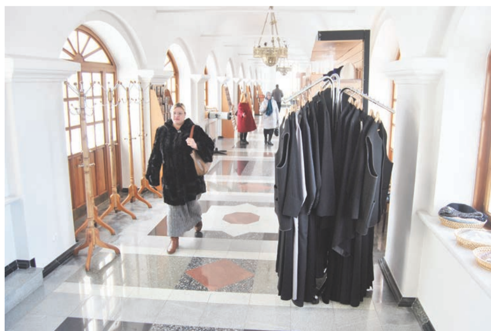
В Ново-Тихвинском женском монастыре можно купить мужской подряник, который стоит почти шесть тысяч рублей