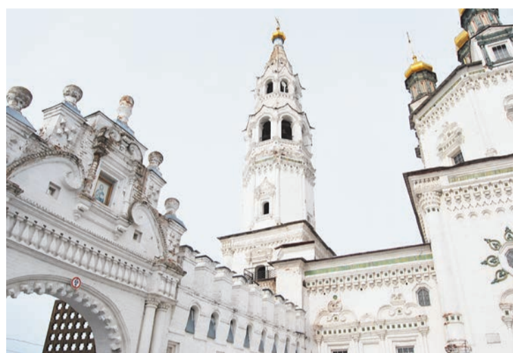
В Верхотурский кремль попасть не удалось, оказалось, что по понедельникам он закрыт

По поверью воду в чаны набирают из живительного источника, который забил из земли, когда вышел гроб Симеона Верхотурского. На гроб мы посмотрели, спустившись в подвальное помещение.