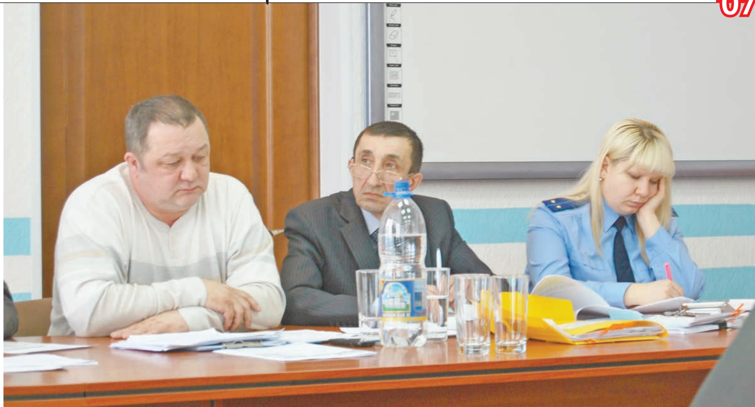
Депутаты слушают речь о Путине

– Давайте сразу обсудим вопрос, за что мы награждаем нашего президента? За выполнение его профессиональных обязанностей? За паралимпийское и олимпийское движение? Это его прямые обязанности и за это мы будем его награждать? За это мы героя