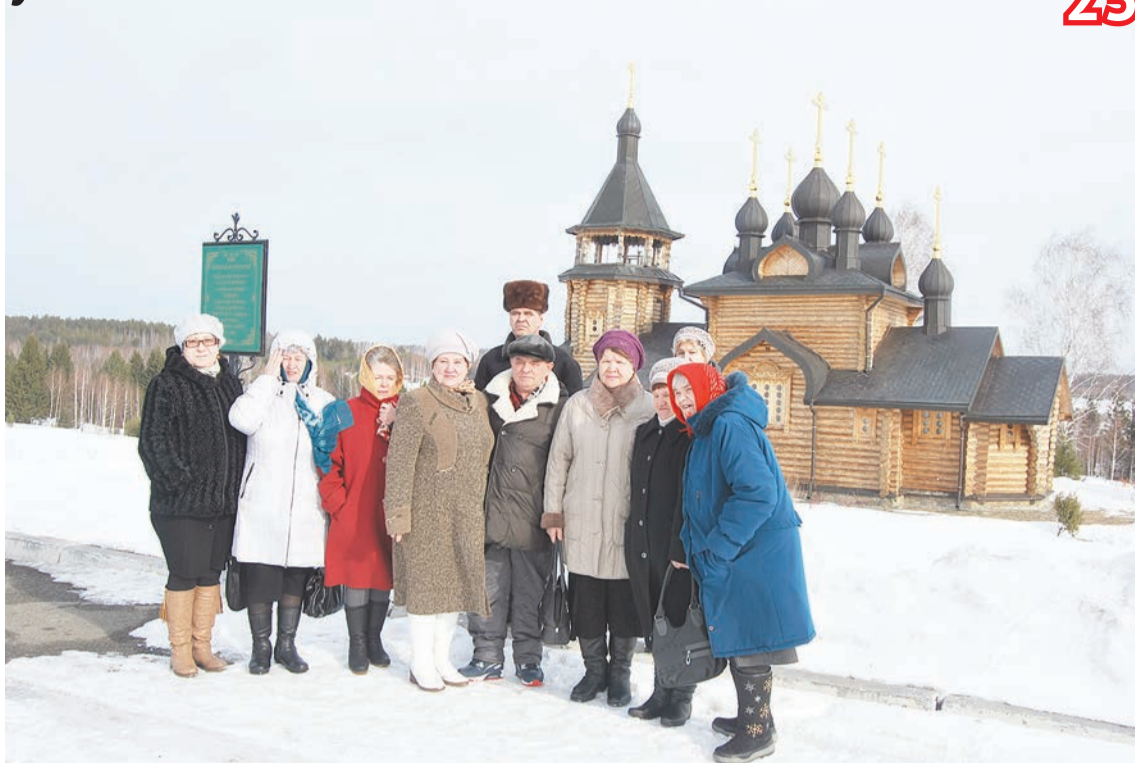
Первое святое место, которое посетили качканарцы — храм во имя всех Святых, расположенный вблизи камня, где Симеон Верхотурский любил удить рыбу

Корреспондент «Нового Качканара» посетил три храма и кремль