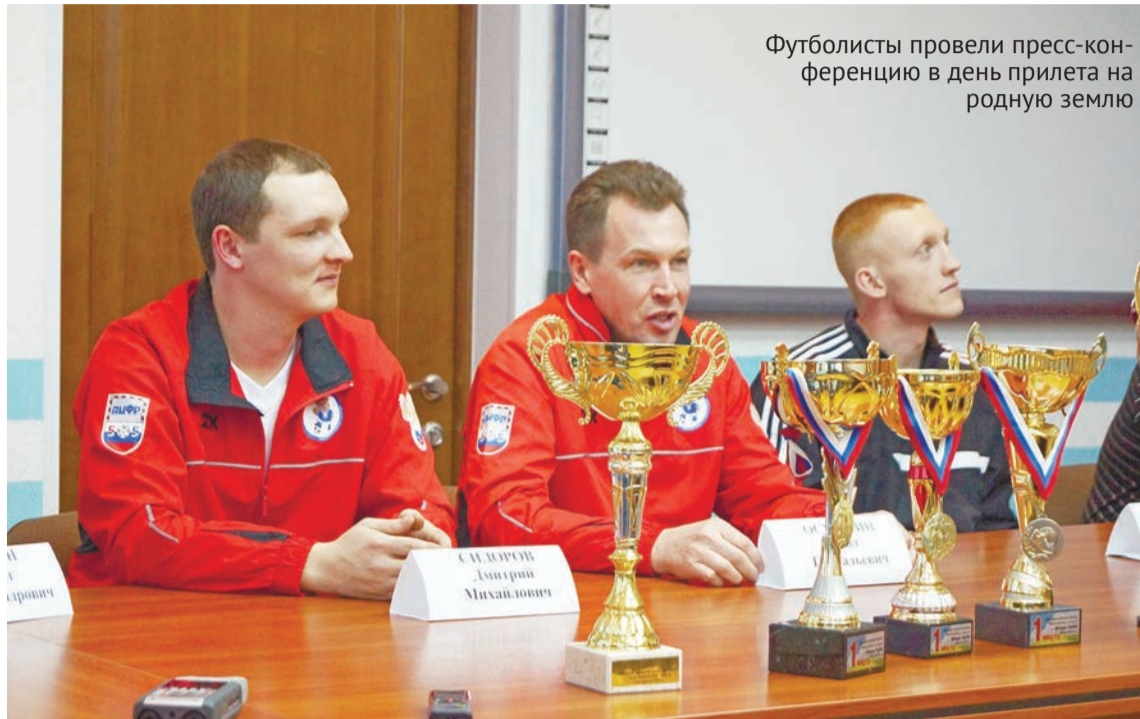
Футболисты провели пресс-конференцию в день прилета на родную землю

Впечатлениями делились все. Больше всего качканарцам запомнились игры, когда 11 болельщиков (родители, учителя, воспитанники «Олимпа»), которых земляки взяли с собой, всеми силами поддерживали их во время матчей. Когда победили, плакали даже папы. А как радовались ребята, когда