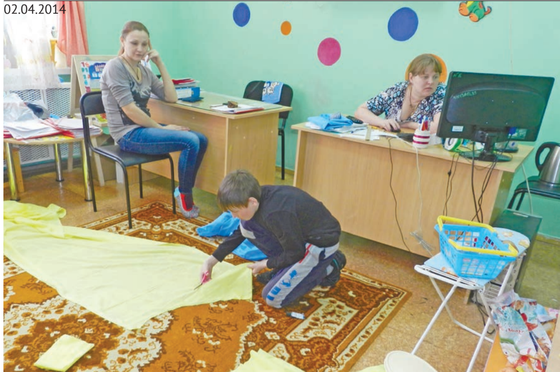
В центре каждый занят делом