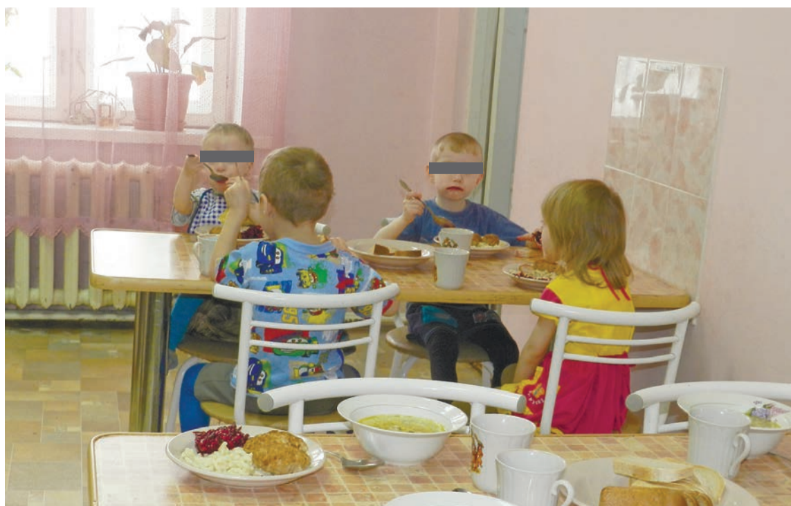
Кормят в центре вкусно. И много

– Наша цель – это возврат в семью. Мы стремимся провести реабилитацию, коррекцию, снизить агрес-