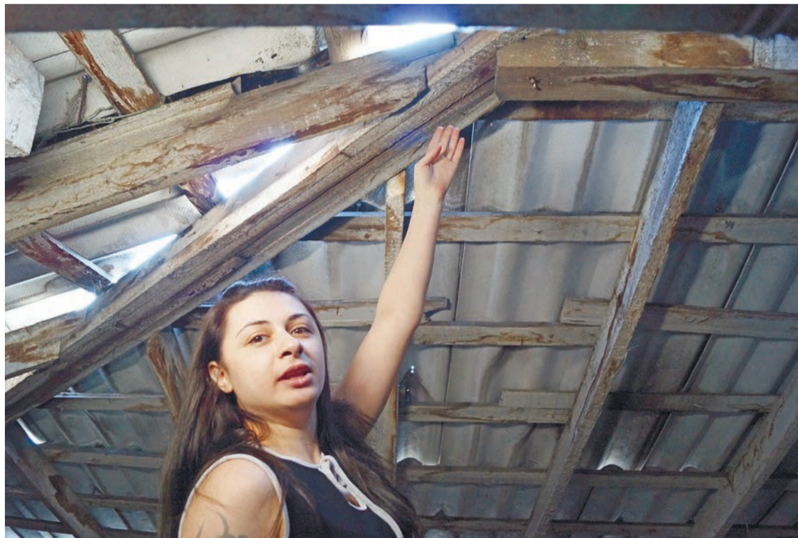
Через дырявую крышу ночью можно наблюдать за звездами!

Недавно деревяшку посетили ребята из социального центра – у них была «Неделя добра». Грязные исписанные стены старой деревяшки они обновили: освежили фон новой зеленой краской и украсили его яркими рисунками. Доброта их была