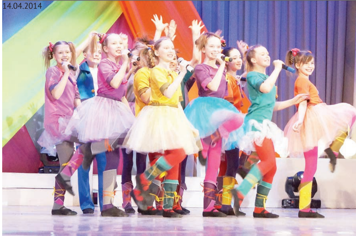
На сцене — коллектив Дома детского творчества