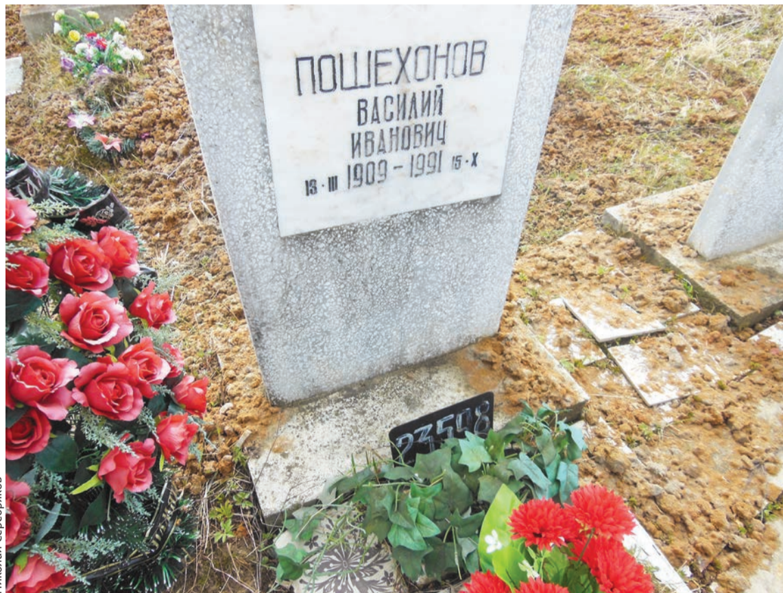
Вот оно, последнее эхо моей войны