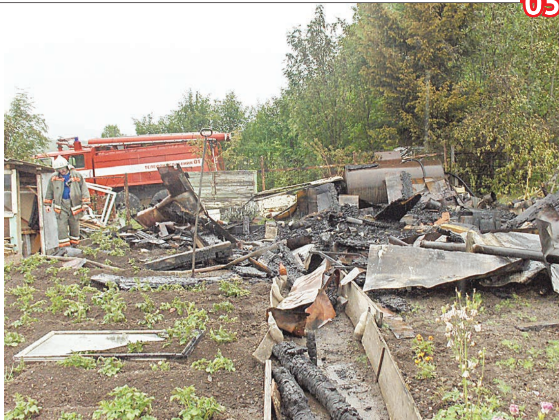
Среди развалин пожарные не сразу обнаружили останки мужчины

А водитель машины, находящийся в данный момент на лечении в хирургии ЦГБ, отказался от объяснений, сославшись на 51-ю статью Конституции РФ, по которой он может не давать показаний против самого себя.