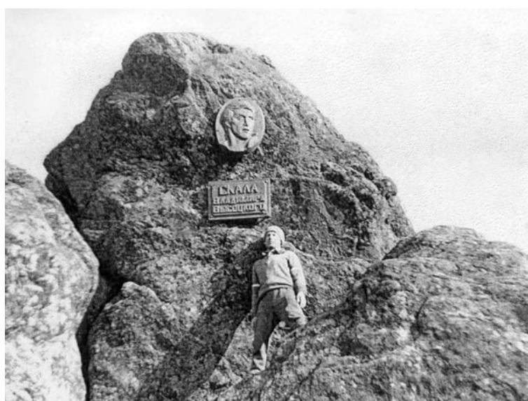
У скалы. Высоцкого. 80-е годы

ния Крыма в родную гавань, настало время Одессы, как и всей восточной Украины. Настала пора культурного общения народов России, Крыма, Украины и независимой Одессы. Поэтому барельеф Высоцкого должен быть доставлен в одесский драмтеатр рейсом «Екатеринбург – Москва – Одесса».