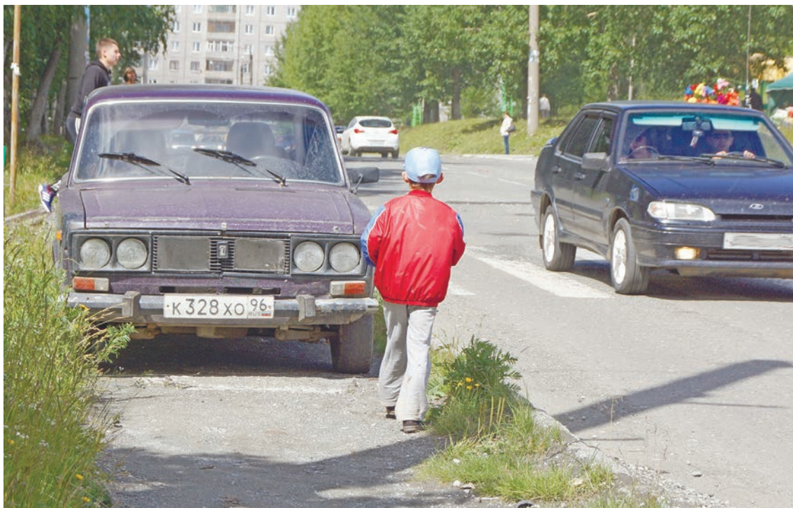
Водитель бросил машину прямо на тротуаре, а пешеходы вынуждены обходить ее по проезжей части