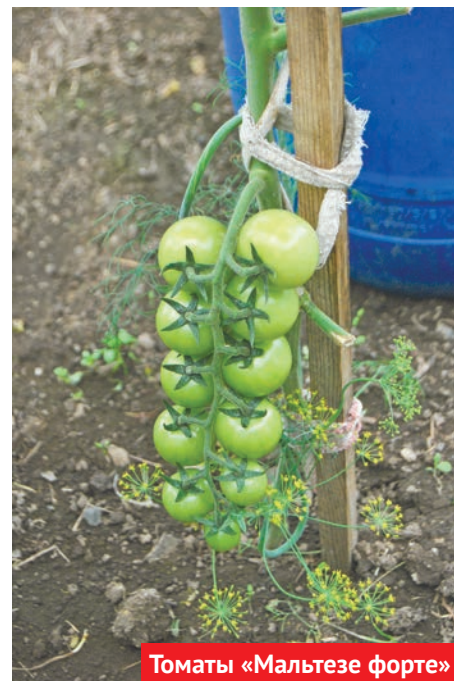
Томаты «Мальтезе форте»

Если у вас есть вопросы – звоните по телефону 6-61-86 , можете написать в редакцию на купоне бесплатного объявления или на простом листочке и опустить в ящик для бесплатных объявлений «Нового Качканара».