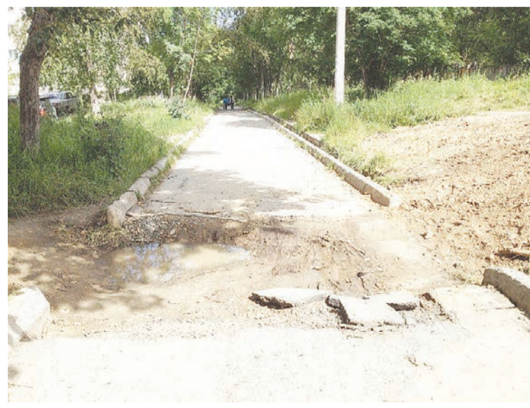
Перерывная пешеходная дорожка рядом с «Сакурой» – наша ежедневная полоса препятствий