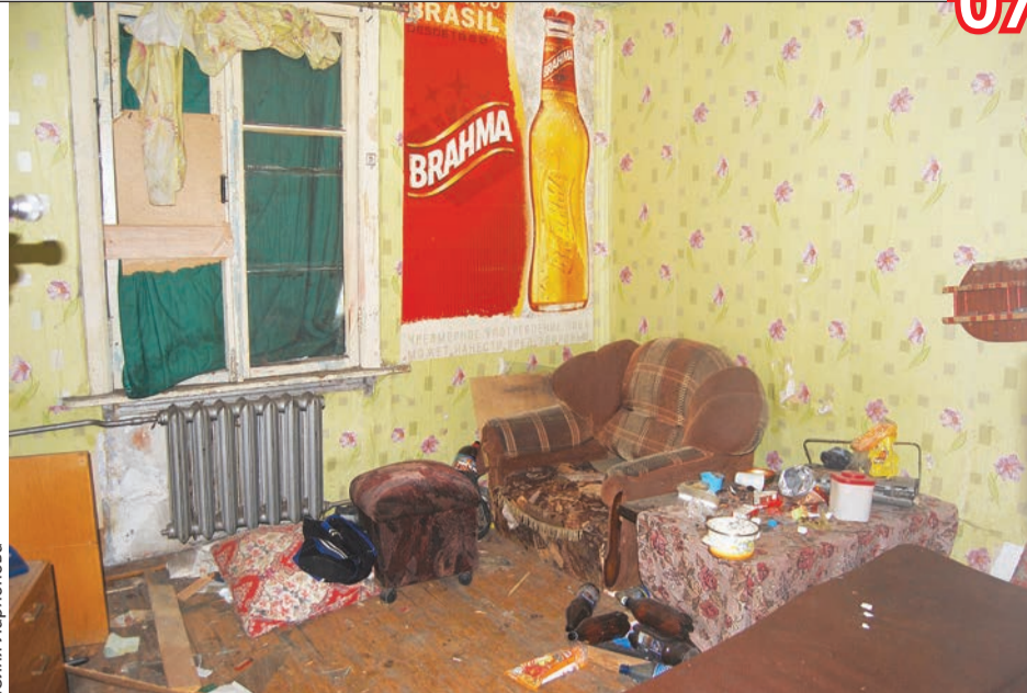
Хозяйка квартиры появится только через два года, но нет гарантии, что она начнет платить по долгам