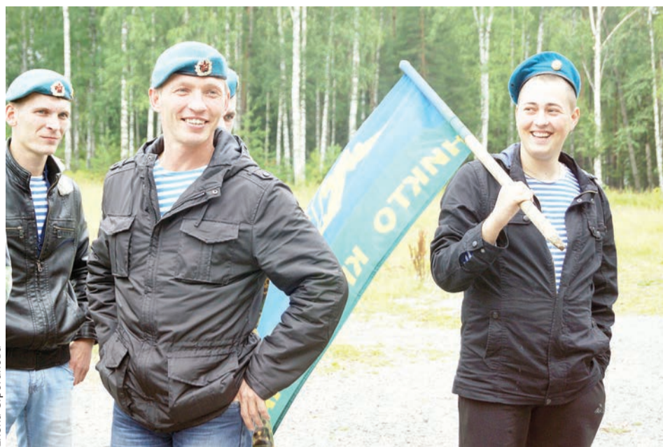
Закончился праздник массовым гулянием и спортивными состязаниями на футбольном поле у лодочной станции

Вечером праздник продолжился на запасном поле возле лодочной станции. Была организована спор- тивно-развлекательная программа. Звучали песни. Виновники празд- ника активно участвовали в спор- тивных состязаниях: армрестлинге, поднятии гири, стрельбе из автомата, футболе, перетягивании каната и других конкурсах. Особенно было