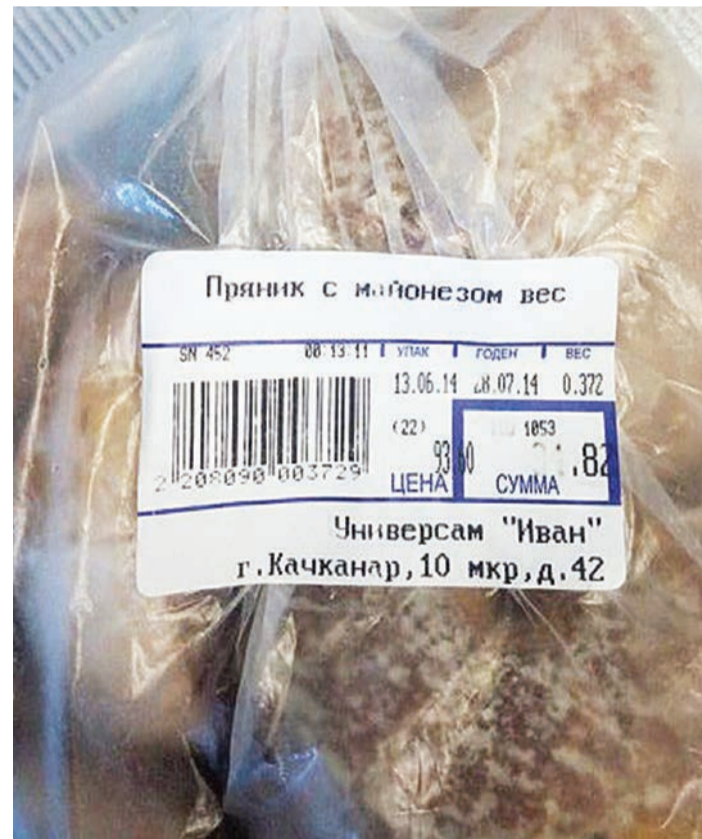
Пряник в майонезе!