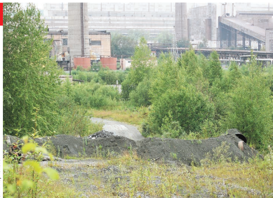
Как говорят, именно за этой трубой и нашли кости