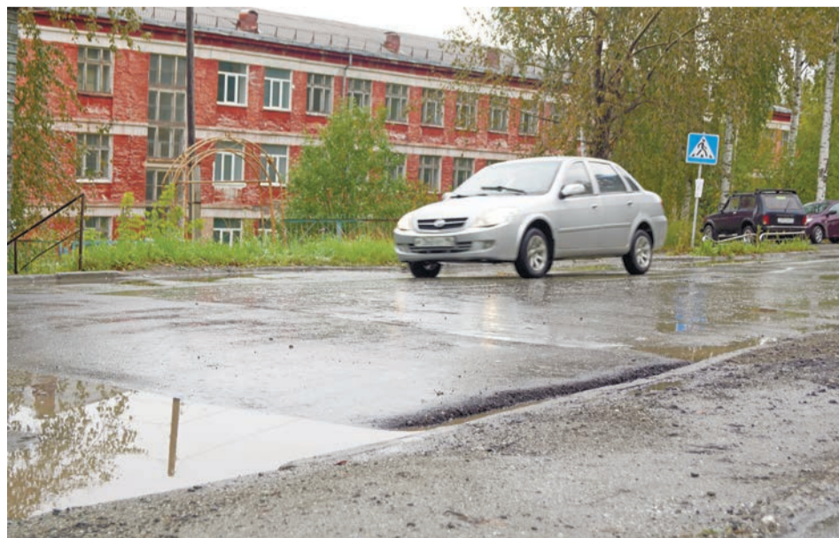
«Полицейский» среди ям – обыденность для нашего города