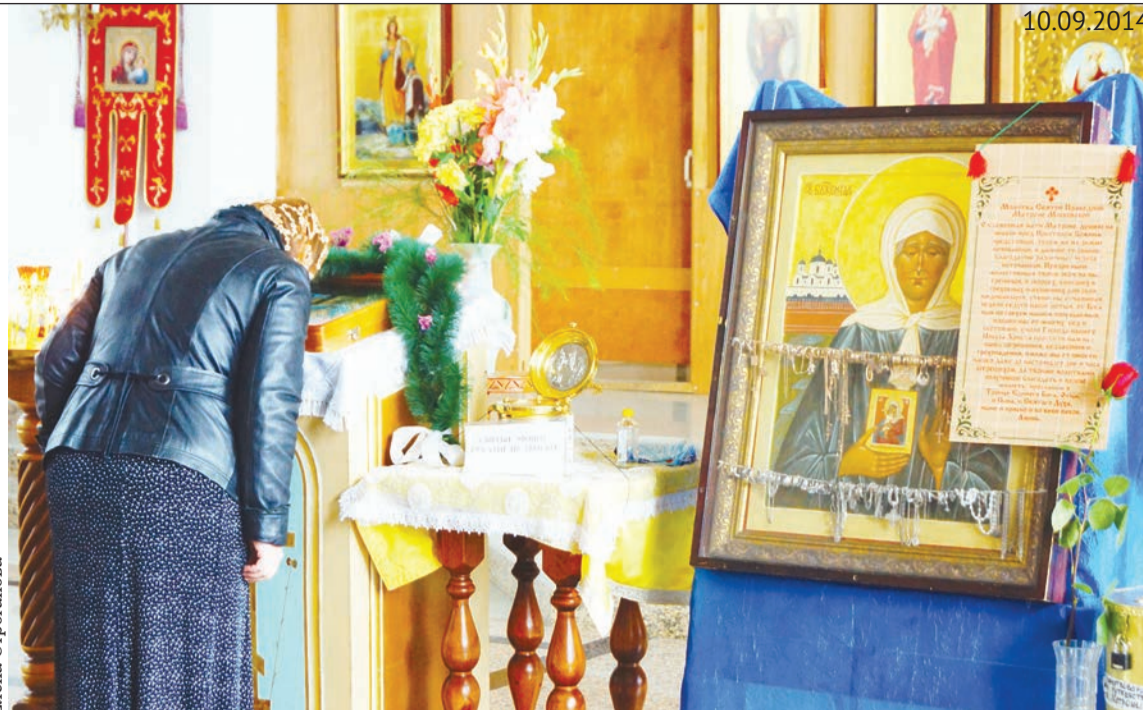
Икона и ковчег с частицей мощей святой Матроны будут в Качканаре еще три недели