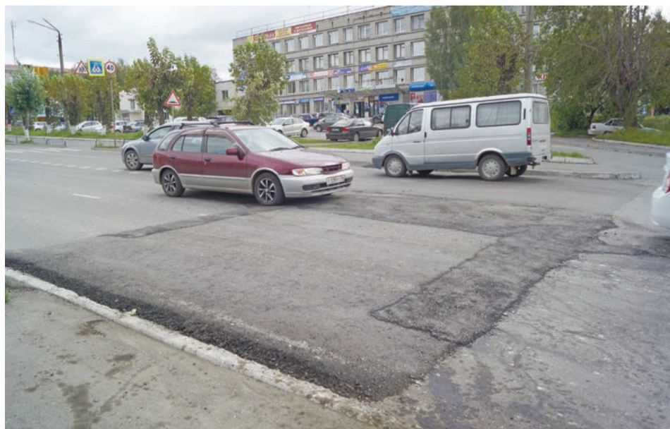
Искусственная неровность может быть неровной!

– На участке дороги напротив треста каждый год происходят ДТП с детьми – хотя бы раз в год на