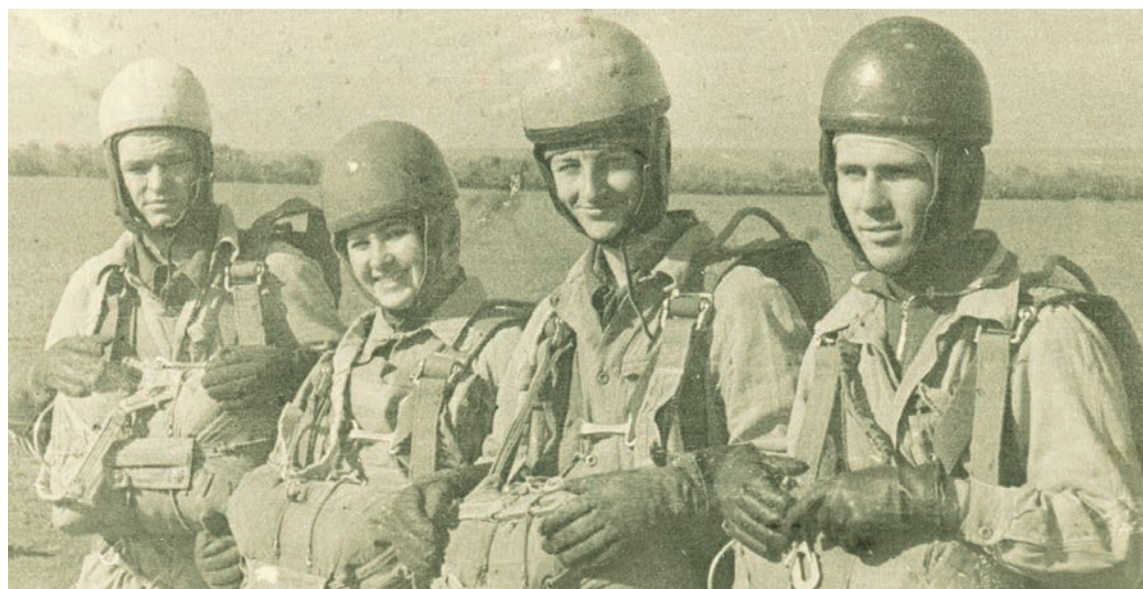
1963 год. Ростовский аэроклуб