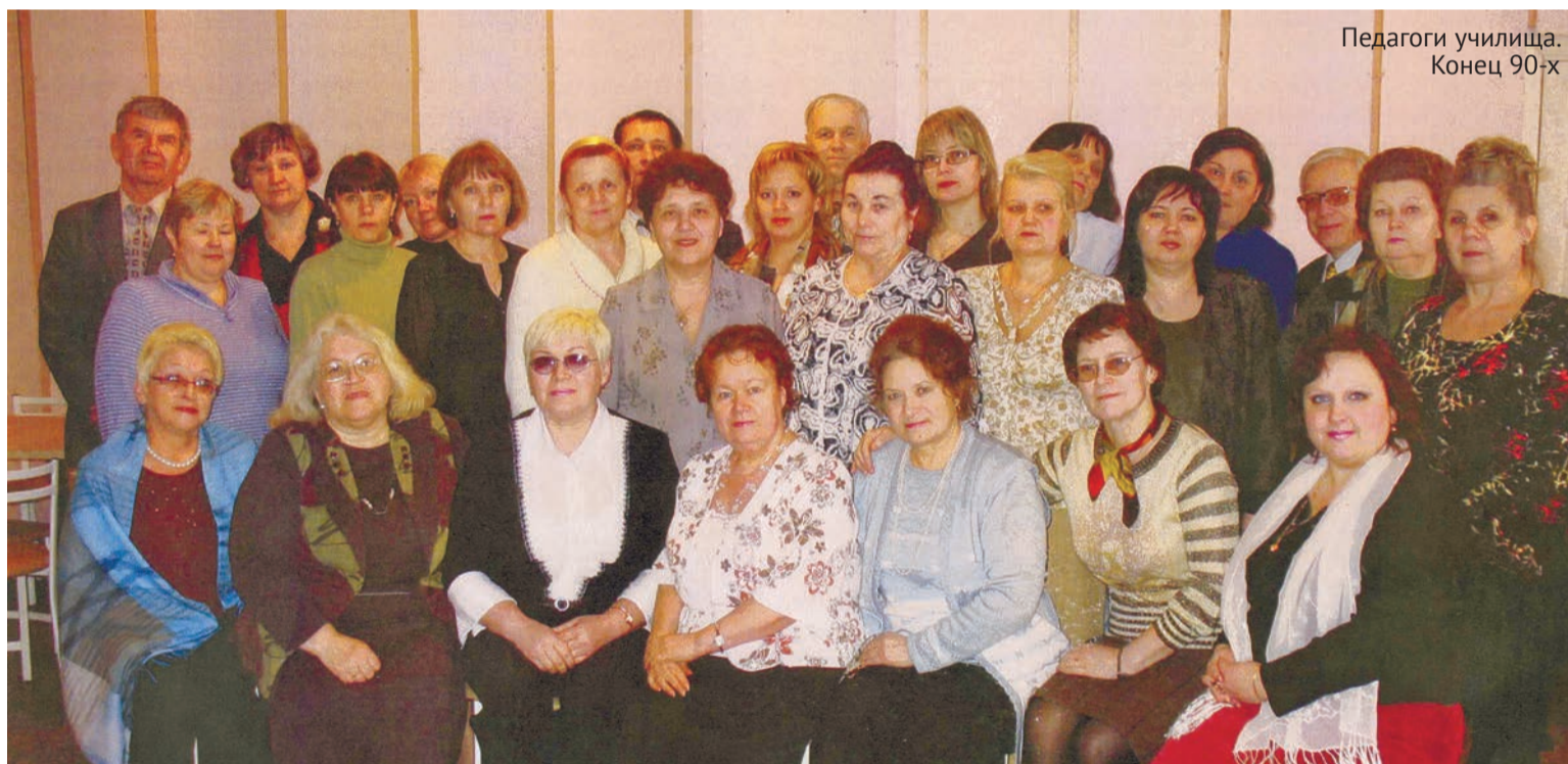
Педагоги училища. Конец 90-х