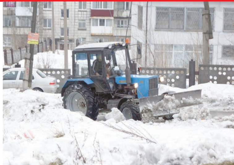
Пока еще на наших улицах можно увидеть новую технику

Город деньги нашел, и на 20 миллионов рублей мы взяли в лизинг дорожную технику: тяжелый автогрейдер для уборки снега и расчистки грунтовых дорог, многофункциональную дорожную машину со щеткой, отвалом, подсыпкой и поливом, машину-«пылесос» с ёмкостью бункера 2 куба и навесную фрезу на трактор МТЗ-82.