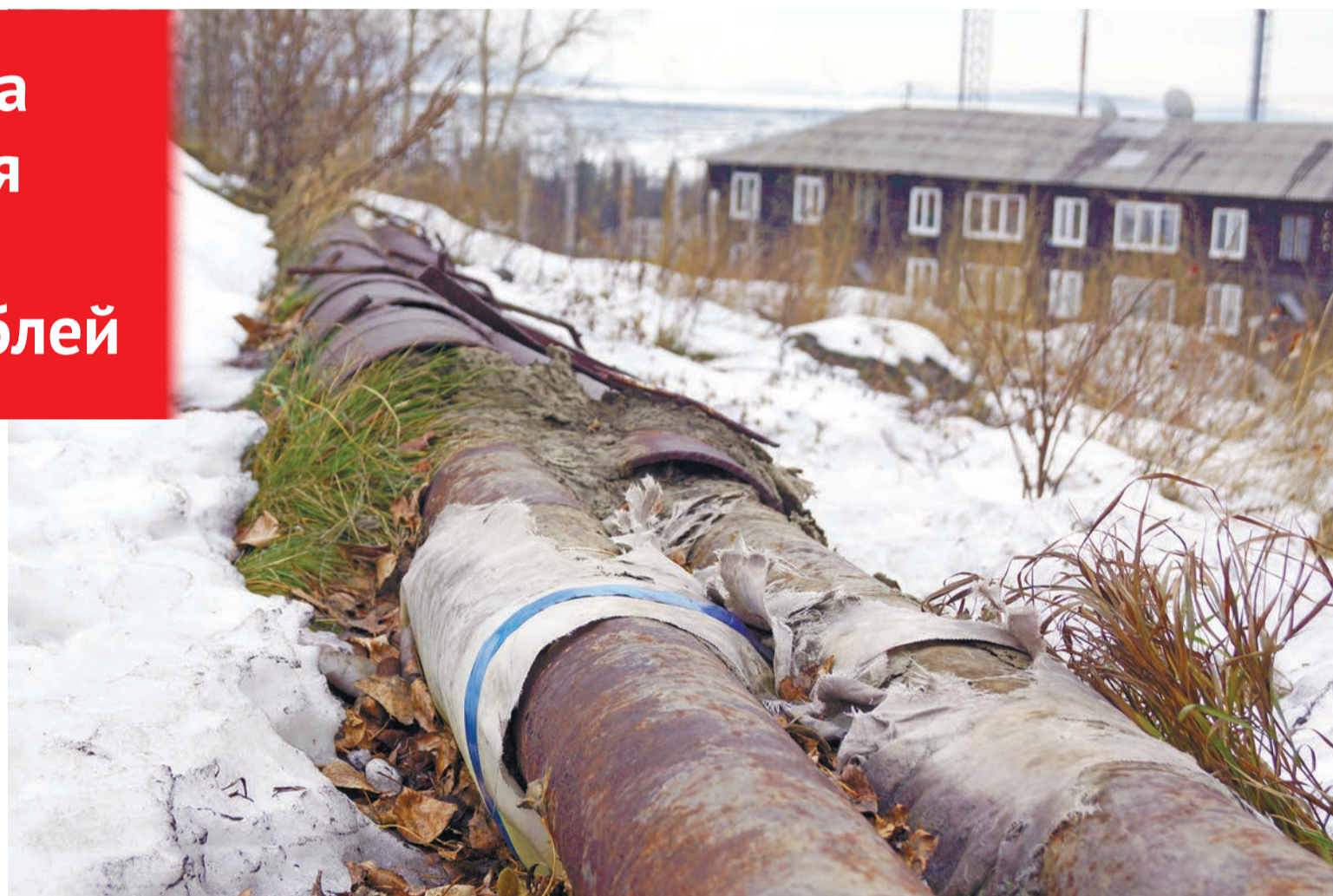
Первомайка. С прошлой публикации прошел год. Трубы так и не изолированы.

Чтобы горожанам было понятно, откуда взялись долги, вспомним новейшую историю. В 2011 году Качканарскую ТЭЦ ку-