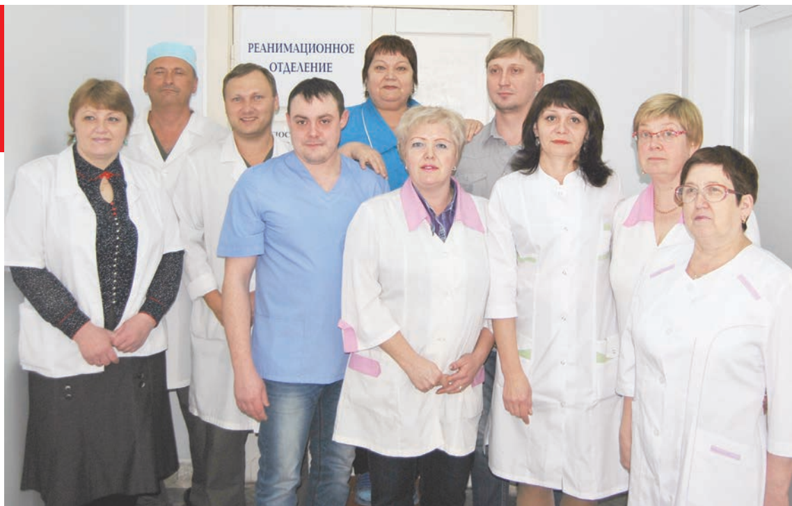
Спасать жизни людей они готовы в любое время дня и ночи

Тем не менее, медперсонал старается идти навстречу родным пациентов.