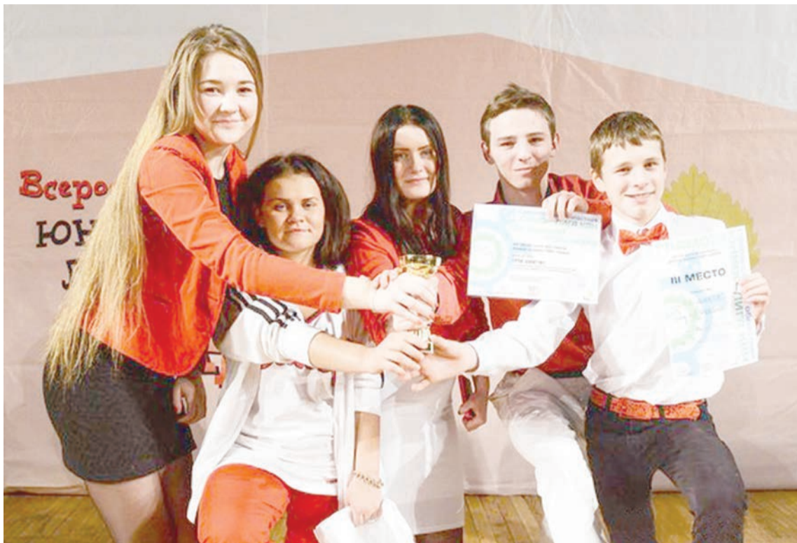
Команда «На диете» голодные до побед

— Парни любят побеситься, посмеяться на отвлечённые темы, поэтому мы с На-