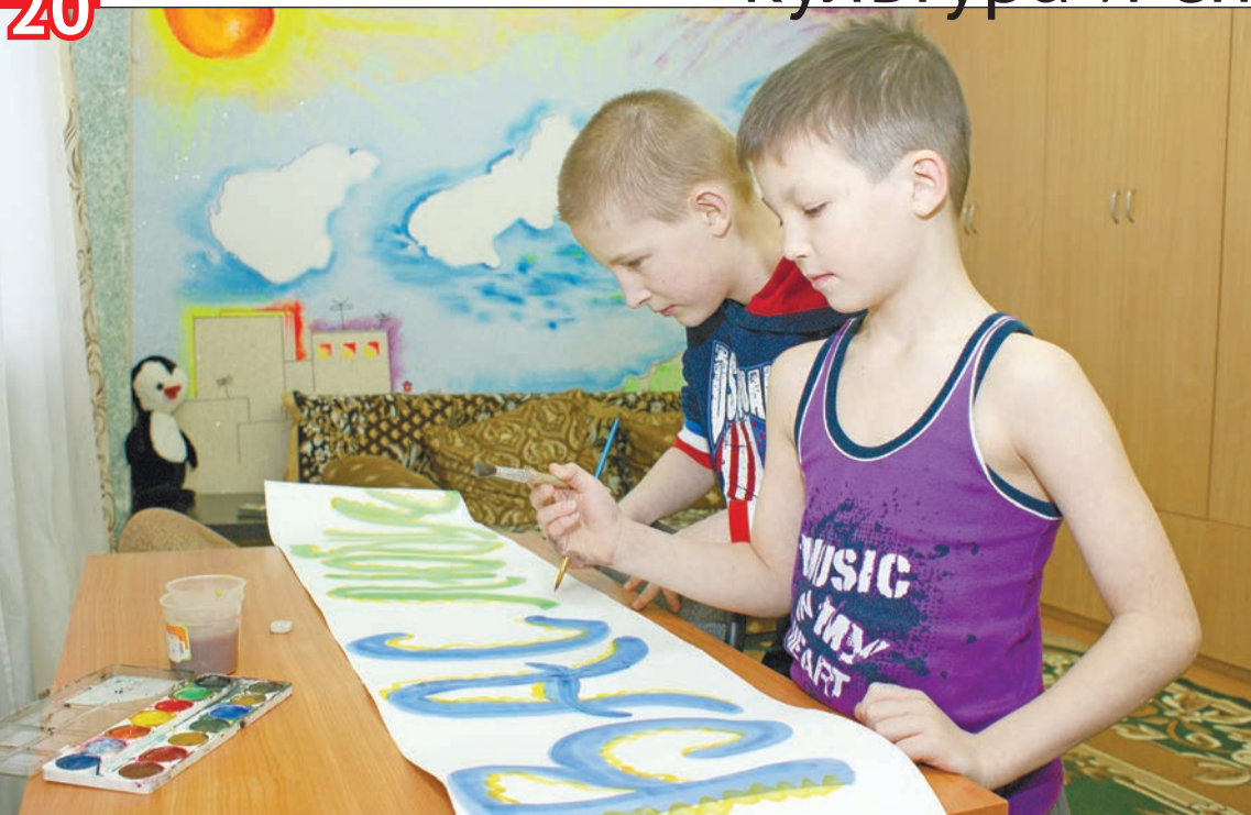
Мальчики готовятся к встрече выпускников