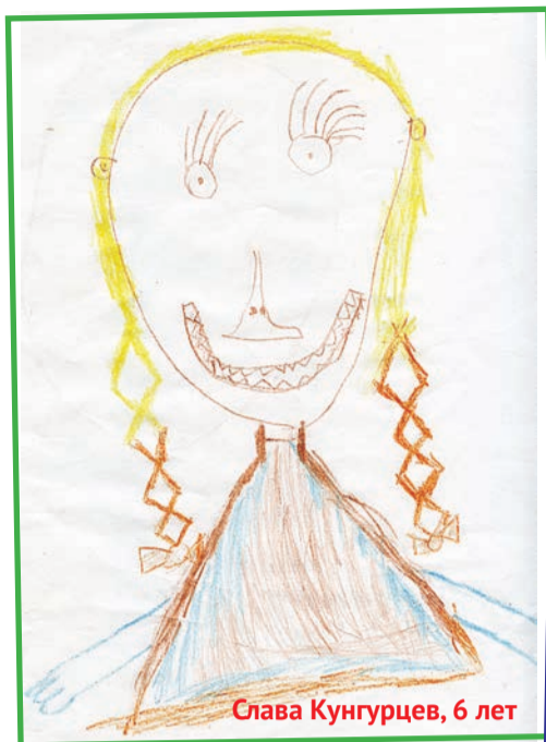
Слава Кунгурцев, 6 лет