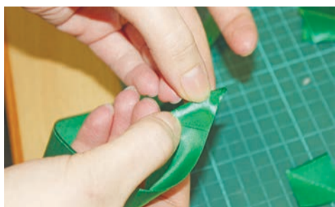
1 – Режем атласную ленту на квадратики.