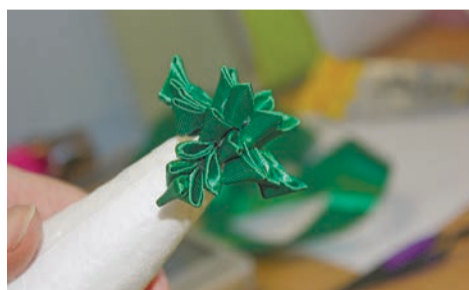
8 – Перед вами верхушка елки. Не пугайтесь, черное потом замаскируется, когда придет время украшать нашу красавицу.