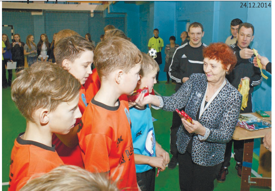
Людмила Алексеевна любит приходить в гости к юным футболистам

В полиции советуют: в случае если вы никогда не оформляли кредит, а звонки от неизвестных не прекращаются, обращайтесь в органы внутренних дел.