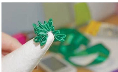
7 – Крепим трехлепестковые веточки к основе, делаем это с помощью все того же клеевого пистолета.

Теперь делаем пятилепестковые ветки, их понадобится немереное количество. Делаем их так же, как трехлепестковые, плюс клеим еще два лепестка снизу.