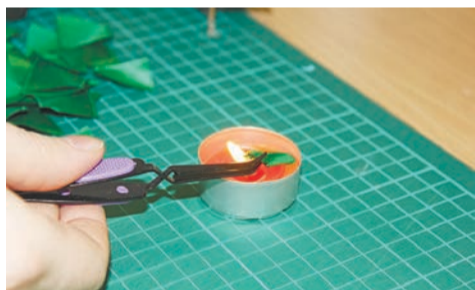
4 – С помощью пинцета и свечки оплавляем и склеиваем кончики получившегося треугольника.