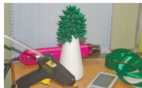
9 – Дальше движемся вниз, приклеивая пятилепестковые ветки к конусу. Елочку можно украсить бусинками.