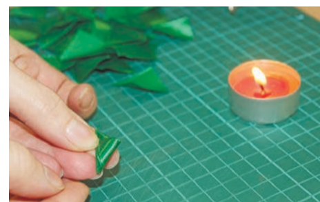
6 – Между двух лепестков приклеиваем третий.