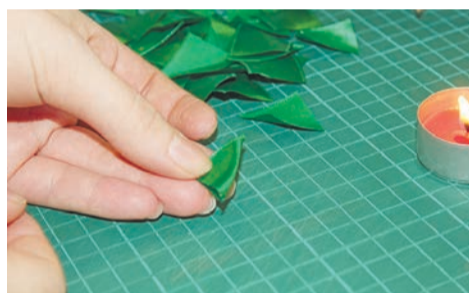
2, 3 – Поочередно складываем квадратики в три раза, чтобы получился маленький треугольник.