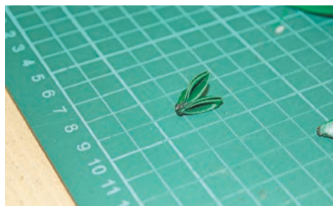
5 – Затем с помощью клеевого пистолета приклеиваем один лепесток к другому.

Готовые трехлепестковые веточки, их нужно всего шесть штук, мы приклеим к верхушке.